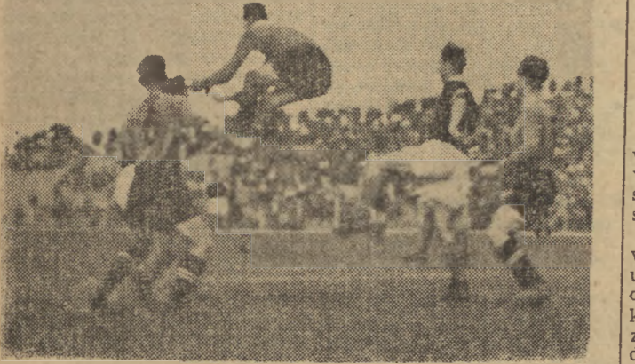
Rozgrywki ligowe weszły już w ostatnią fazę. Każdy mecz - to walka o cenne punkty...