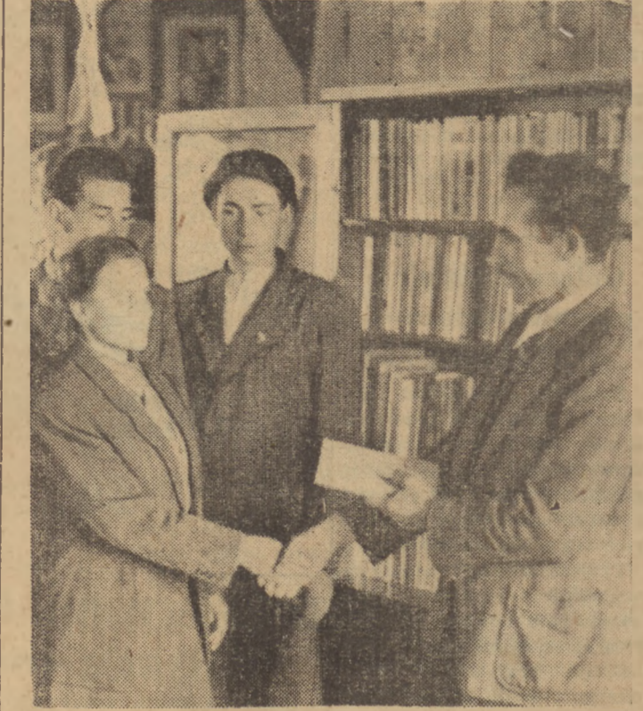
ZMP-owcy zorganizowani w kole przy RSW „Prasa” ofiarowali dwie biblioteki, po 250 tomów każda, młodzieży wiejskiej w Stoguch i w Długim Polu.