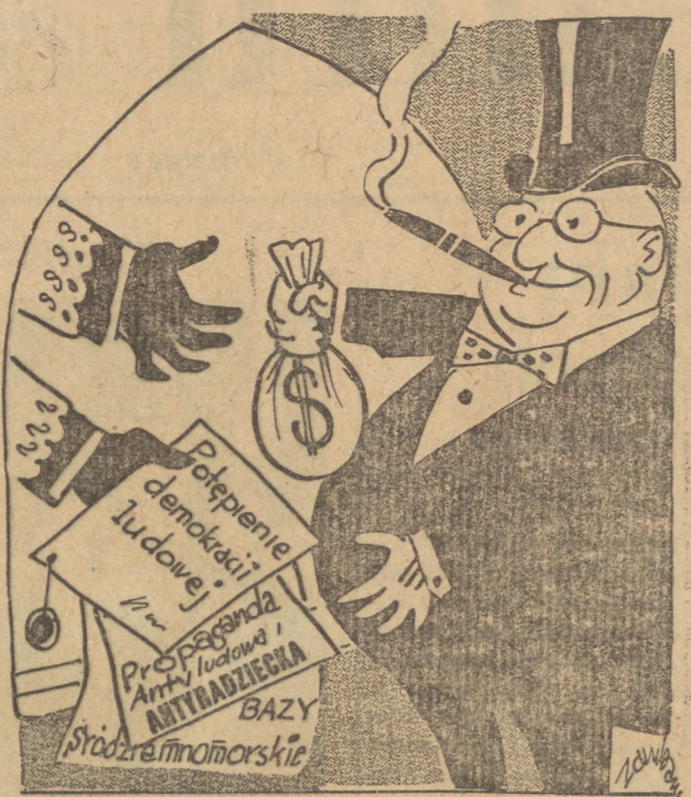
Współpraca Watykanu z imperializmem amerykańskim układa się zadowolająco dla obu stron