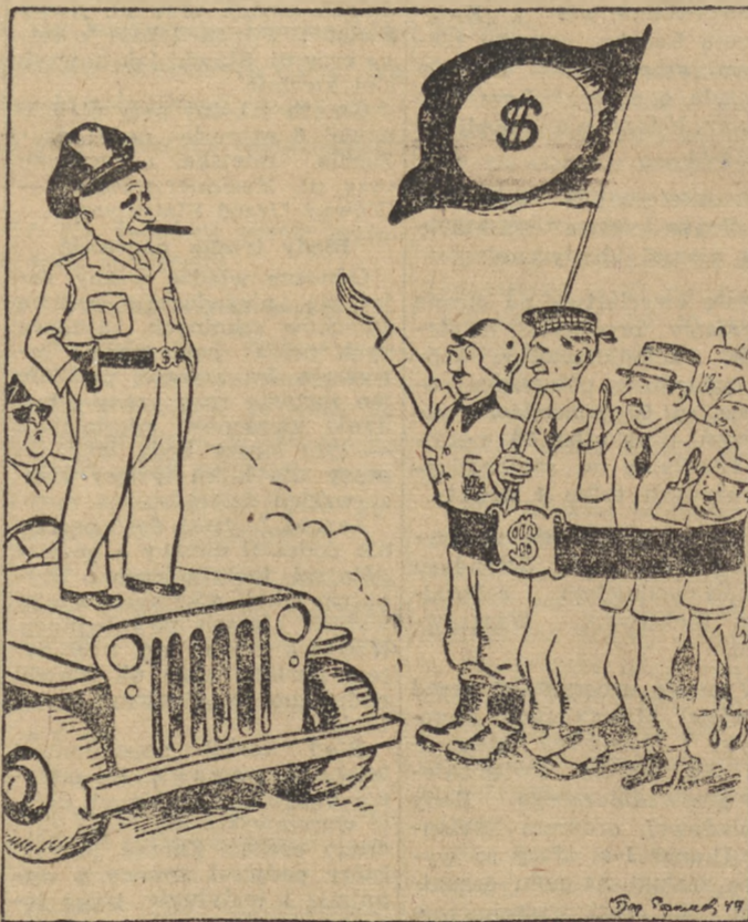
Szef sztabu amerykańskiej armii gen. Bradley, w towarzystwie szefów sztabu marynarki i lotnictwa USA, dokonali przeglądu sił zbrojnych krajów „marshallowskich”