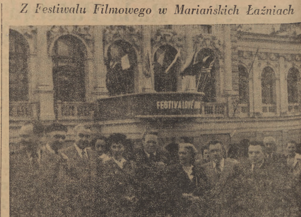
Delegacja radziecka na VI Międzynarodowy Festiwal Filmowy w Mariańskich Łaźniach. Stoją od lewej: wice minister Kinematografii ZSRR...