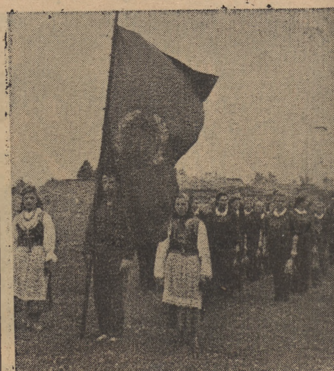
W Warszawie odbyły się dwudniowe zawody lekkoatletyczne między reprezentacją Ludowych Zespołów Sportowych a Zrzeszeniem Sportowym „Spójnia”. Na zdjęciu reprezentacja LZS przed rozpoczęciem zawodów