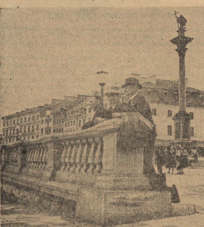
Z całego kraju przybywają do Warszawy wycieczki by zwiedzić odbudowującą się stolicę...