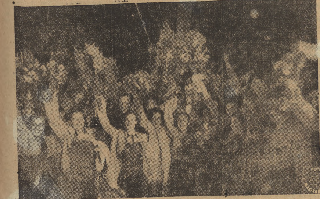
Ludność Budapesztu radośnie wita delegację radziecką, która przybyła na Festiwal Światowej Federacji Młodzieży Demokratycznej.