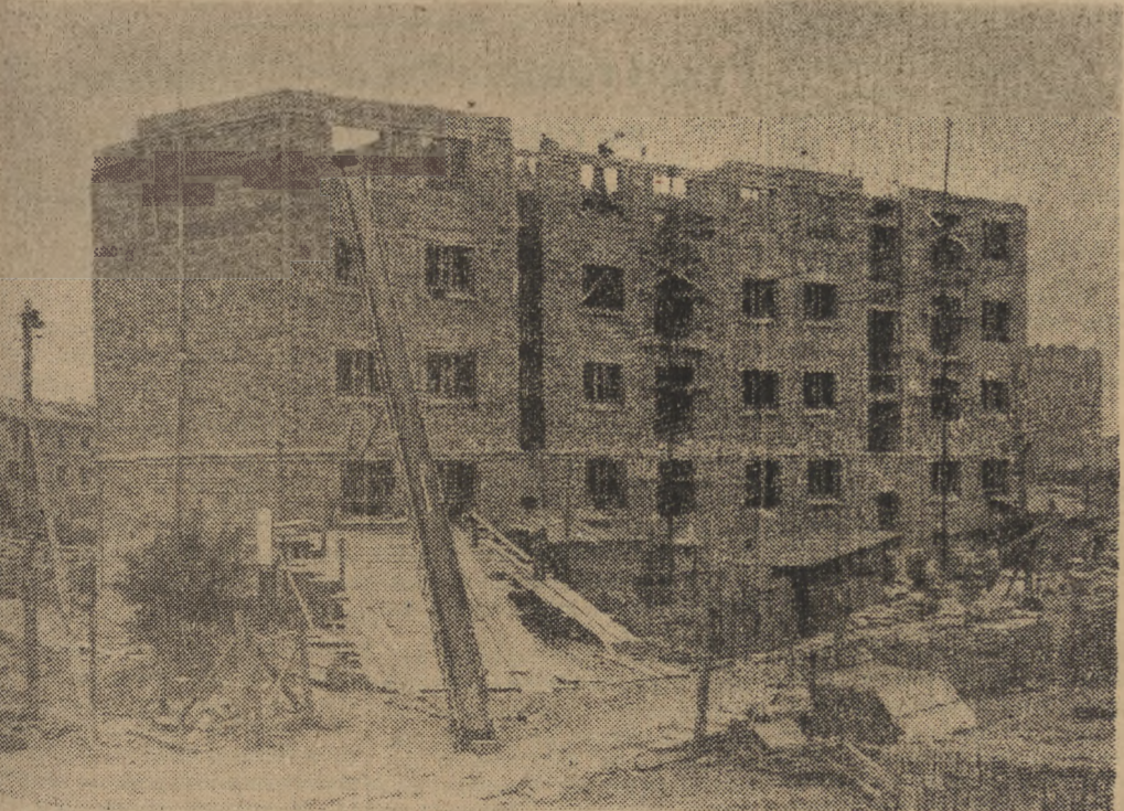
Na Muranowie ukończono budowę domu „szybkościowego“. Budowa i-piętrowego gmachu trwała 29 dni. Dzięki zastosowaniu najbardziej nowoczesnych metod pracy oraz współzawodnictwu plan wykonano na dwa dni przed terminem.