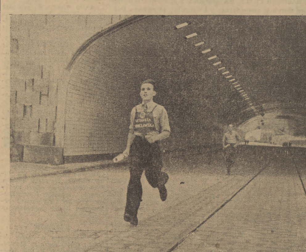
Zawodnik sztafety wrocławskiej przebiega lunem Trasy W-Z.