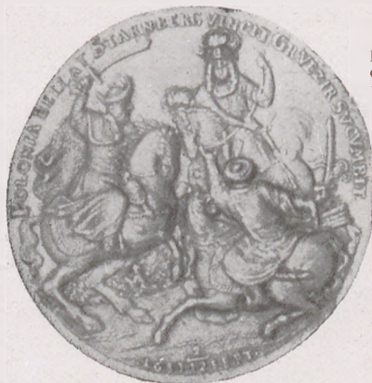
Srebrny medal. — Jan III ze szablą, komendant z bronią palną walczą z turczykiem, pod którym koń upadł, r. 1683.