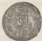
Denar Bolesława III z głową św. Wojciecha.

nowany r. 1024 przez arcybiskupa gnieźnieńskiego. Pierwsze monety polskie pochodzą od Mieczysława I. Na monetach Bolesława I znajduje się napis PRINCEPS POLONIE; BOLIZLAVS DVX i REX BOLEZALLAVS. Na monetach Bolesława III 1102—1139 znajduje się