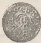
Brakteat arcybiskupa gnieźnieńskiego z XIII-go stulecia z głową św. Wojciecha: † ADVLBERTVS.

głowa św. Wojciecha z napisem SCS (sanctus) ADVLBERTVS. Jest przypuszczenie, iż tę monetę dał bić dopiero po swej pielgrzymce do grobu św. Wojciecha r. 1119, aby uzyskać odpustu.