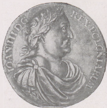
Srebrny medal. — Król Jan III-ci, który wiodąc także Kaszubów, Turków pod Wiedniem pobił w r. 1683.