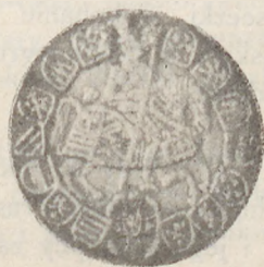
Ćwierć talara Wielkiego mistrza Maksymiliana von Mergentheim 1590—1618.

Typy tych monet są w rozmaitych wyłożone odmianach.