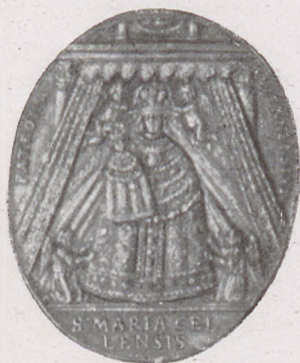
Medalion na pamiątkę odsieczy Wiednia 1683. Str. główn.: widok bitwy, w tyle miasto Wiedeń, nad niem Trójca św. Str. odwrotna: cudowny obraz Matki Boskiej Maryacell, PATRONA VIENENSIVM.