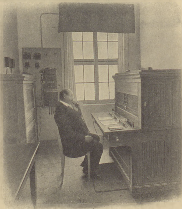
Fernsprech-Centrale des Rudolf-Virchow-Krankenhauses, Berlin

Langjährige Lieferanten staatlicher und städtischer Behörden