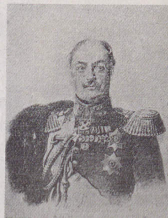
ГРАФЪ П. Д. КИСЕЛЕВЪ