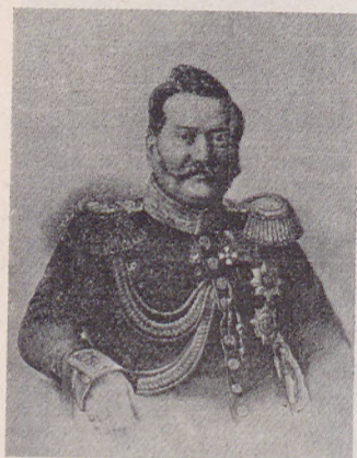
ГРАФЪ Я. И. РОСТОВЦЕВЪ