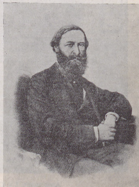
Ю. О. САМАРИНЪ