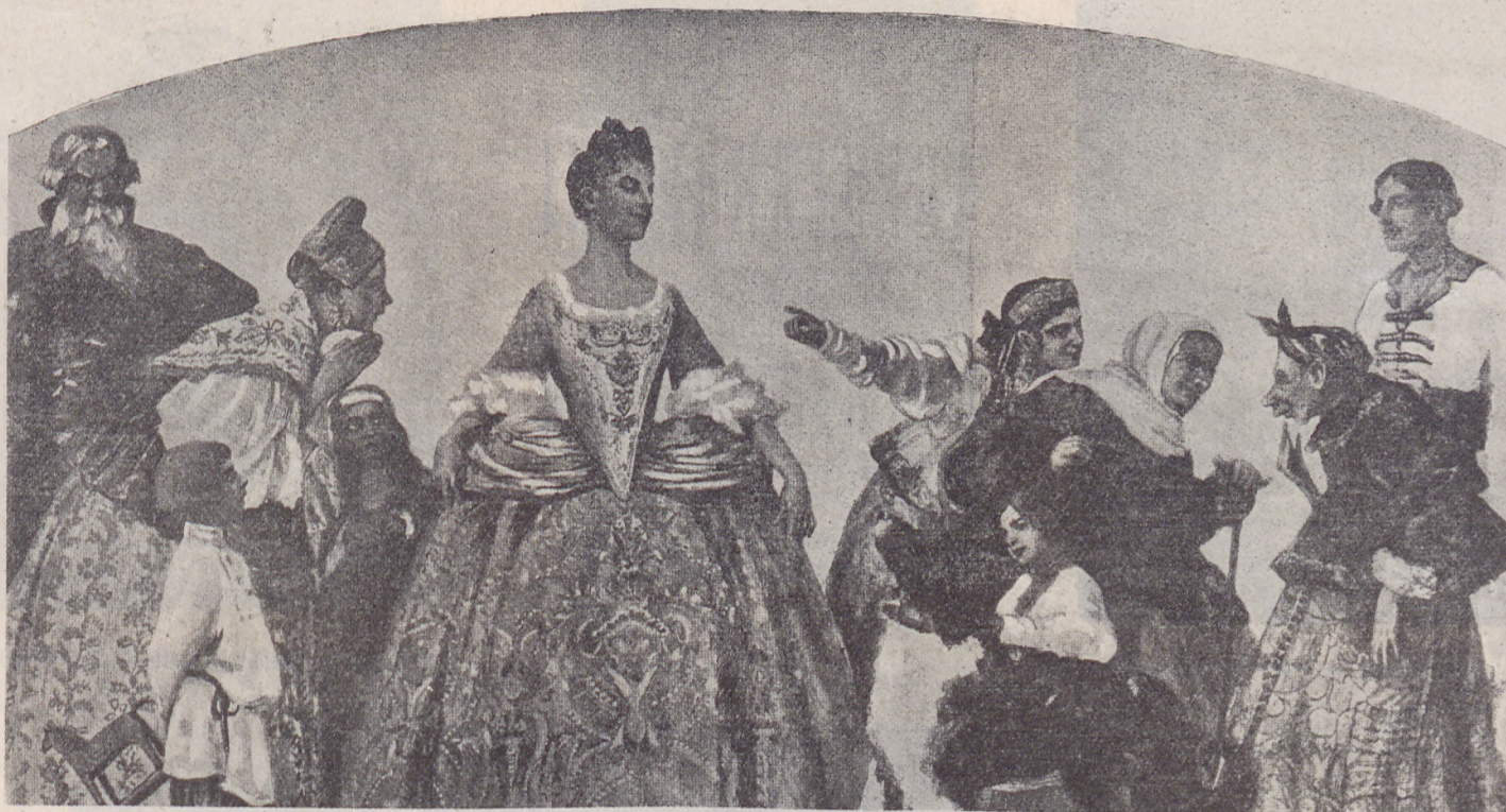
Въ вѣкъ Елизаветы Петровны