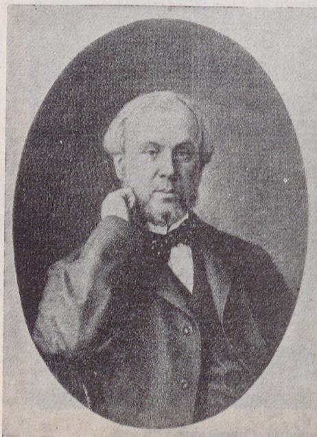
Н. А. МИЛЮТИНЪ