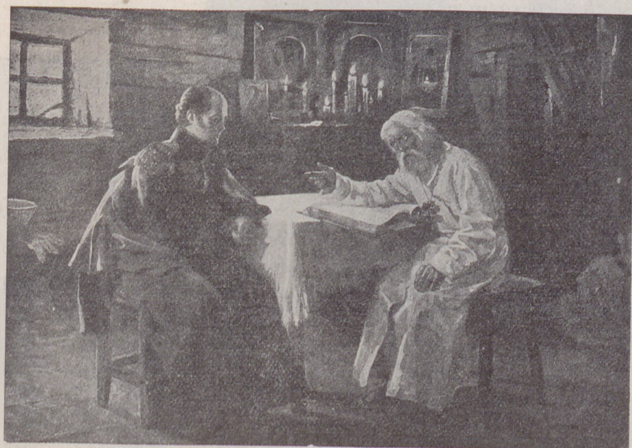
Александръ I у Св. Серафима Саровскаго