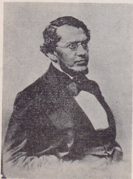
К. Д. КАВЕЛИНЪ