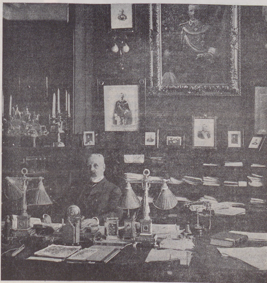
Графъ С. Ю. Витте въ своемъ рабочемъ кабинетѣ