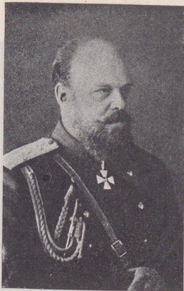
ИМПЕРАТОРЪ АЛЕКСАНДРЪ III