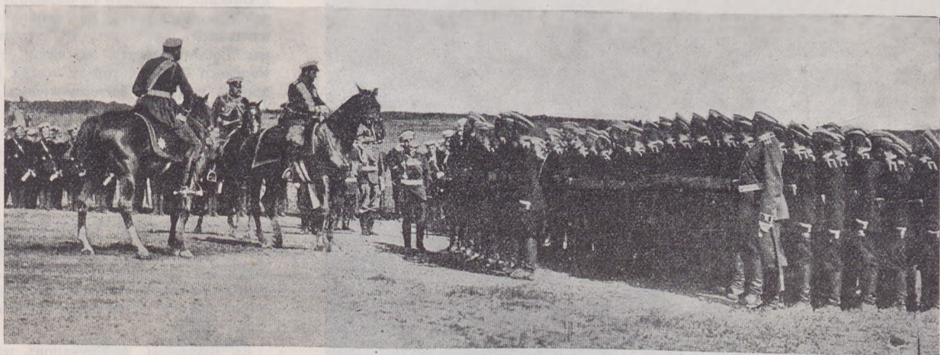
Императоръ Николай II на смотре военныхъ училищъ