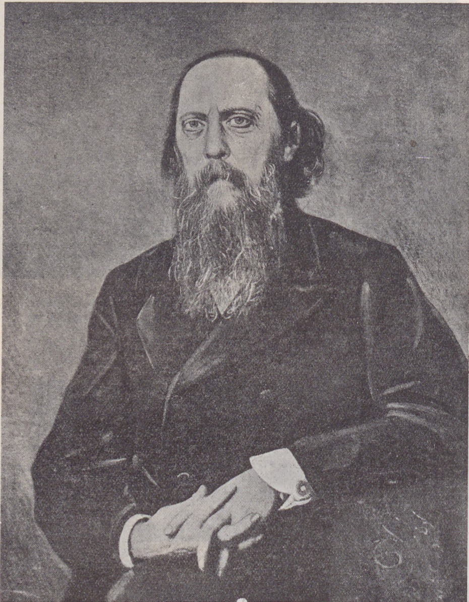
М. Е. САЛТЫКОВЪ - ЩЕДРИНЪ