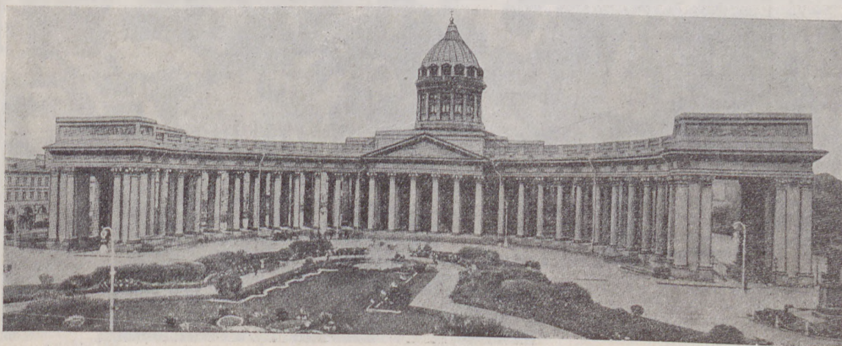
Казанскій соборъ въ С. Петербургѣ

Исторія этой эпохи самая волнующая и интересная. Въ двухъ большихъ томахъ прекрасно и хорошо изложены событія Россіи послѣднихъ дней.