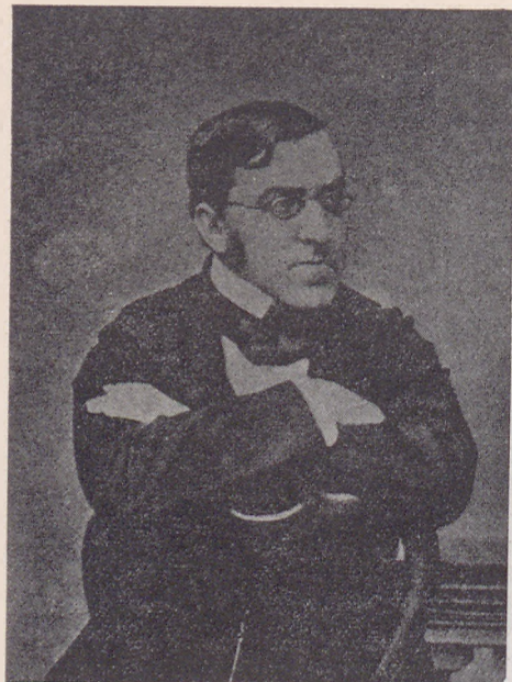
КНЯЗЬ В. А. ЧЕРКАССКІИ