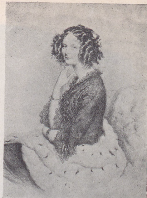
В ЕЛИКАЯ КНЯГИНЯ ЕЛЕНА ПАВЛОВНА