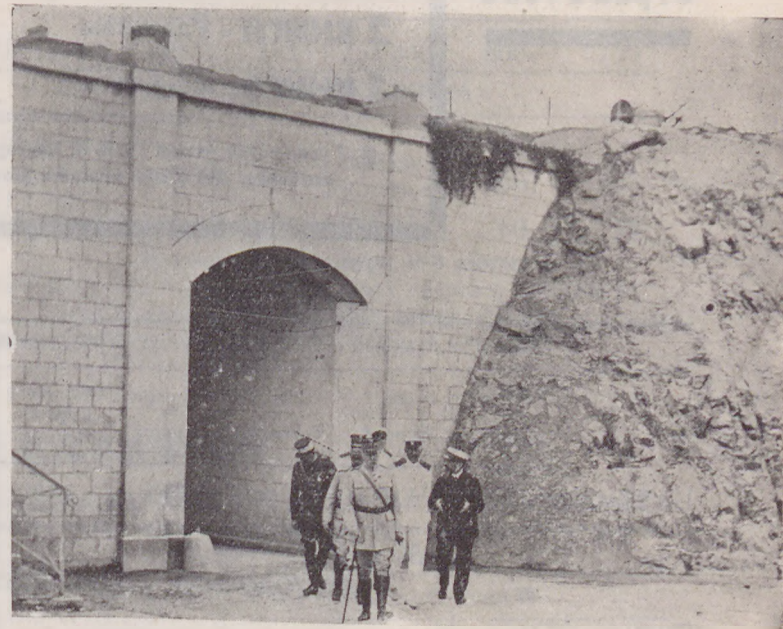
Маршалъ Петѣнь, адм. Герасимовъ, директоръ Морского Корпуса и адм. Эксельмансъ на форту Джебель - Кебиръ (Бизерта), гдѣ пошлся русскій Морской Корпусъ

Въ приложенія къ нашему журналу на 1935 г. вошли 2 книги его лучшихъ разказовъ.