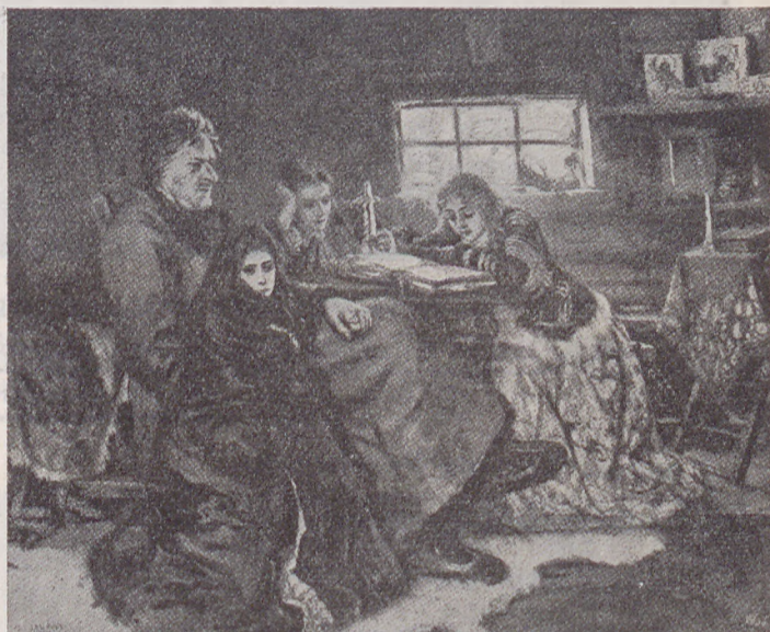
Меньшиковъ въ Березовѣ.