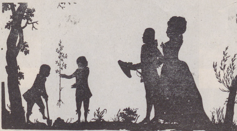
Павель I съ Императр. Маріей Федоровной и Вел. Кн. Александромъ и Константиномъ