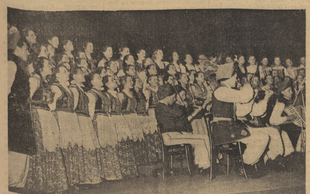
W dniu 29 bm. odbyła się w sali Państwowego Teatru Polskiego „roczysta akademii z okazji zakończenia Światowego Tygodnia Młodzieży. W części artystycznej wystąpiły wyróżnione w ogólnopolskich eliminacjach zespoły artystyczne ZMP. Na zdjęciu: chór ZMP z Liceum Pedagogicznego w Płocku