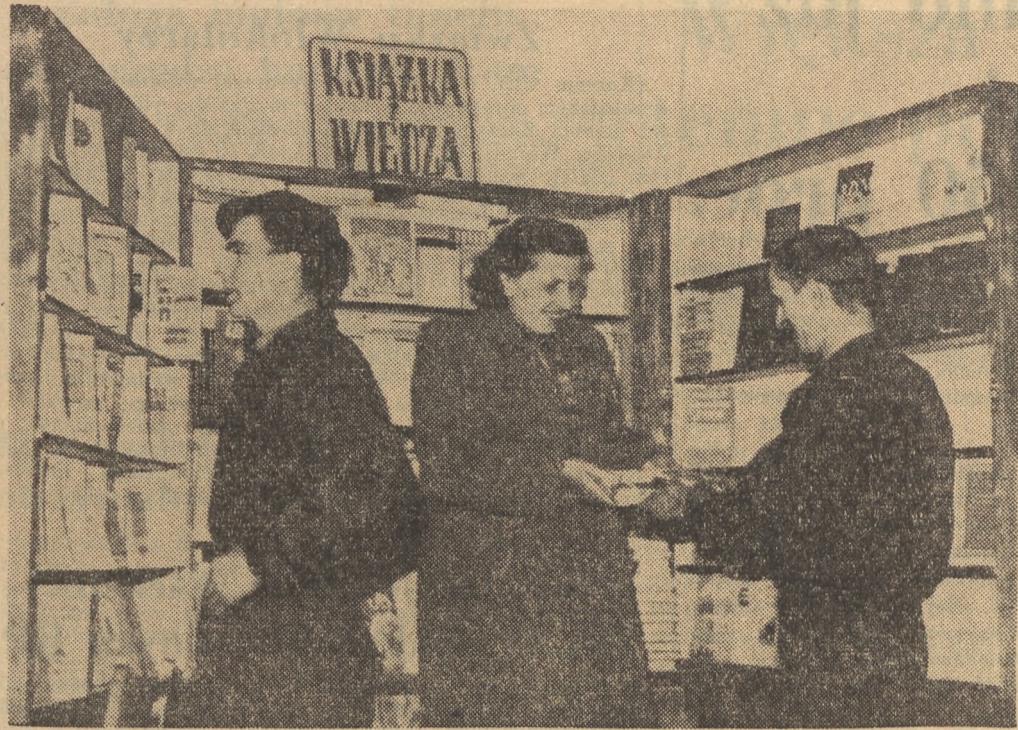
Wielkim powodzeniem cieszy się wśród robotników fabryki „Ursus“, założony tam przez Spółdzielnię Wydawniczą „Książka i Wiedza“, kiosk z książkami.