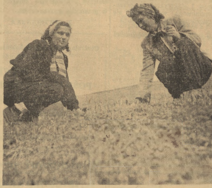
Dolinę Miętosową pokrywa jeszcze gruba warstwa śniegu. Ale w tej samej dolinie kwitną już krokusy