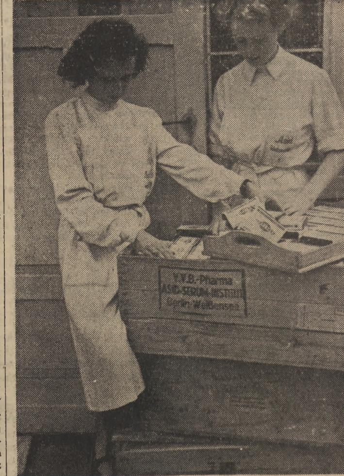
Załoga fabryki lekarstw Asid-Serum w Berlinie powziela uchwałę o przekazaniu koreańskim bojownikom o wolność lekarstw wartości 5.000 mk. wyprodukowanych w godzinach nadliczbowych.