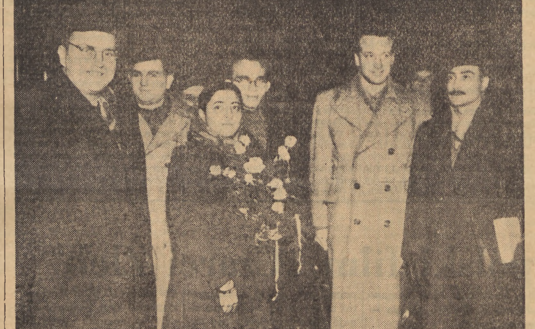
W dniu 30 grudnia ub. r. wawia przejazdem w Warszawie delegacja Międzynarodowego Związku Studentów, zaproszona do Moskwy przez Antyfaszystowski Komitet Młodzieży Radzieckiej. Na fotografii moment powitania delegacji przez przedstawicieli polskich organizacji młodzieżowych.