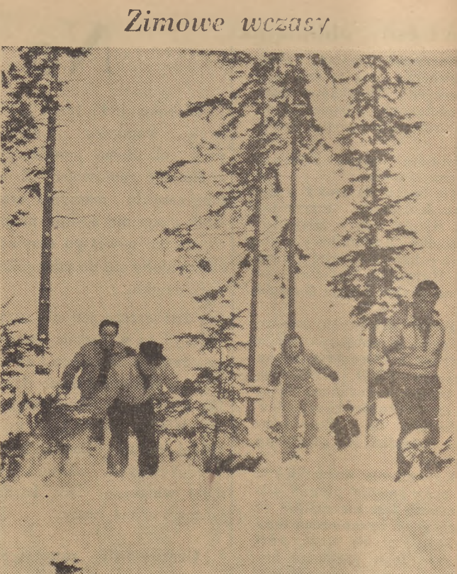
Do najpiękniejszych miejscowości górskich wyjeżdżają liczni wczasowicze. Na zdjęciu grupa entuzjastów „białego sportu“

Stwierdzić zatem wolno, że rok 1949 był obfity w wydarzenia z dziedziny kultury muzycznej, że pogłębił zrozumienie właściwych założeń ideologicznych i że nawiązał nowe podwaliny materialne i socjalne pod przyszłe prace muzyczne.