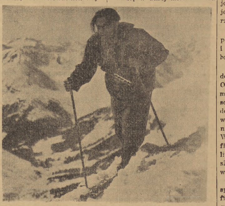
Na chronach stolicy ukazal się nowy film produkcji polskiej „Czarcie Żleb“. Na zdjęciu scena z tego filmu

Trzeba powiedzieć, że do pozytywnych oceny filmu przyczyniła się w dużej mierze dobra