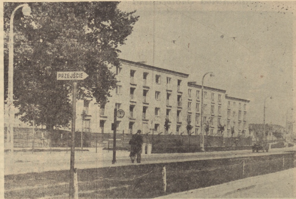
Fragment osiedla mieszkaniowego Młynów przy trasie W-Z w Warszawie, jednego z wież, które zbudowano w okresie 5 lat

I ta walka trwa. Na każdym placu budowy, w każdej pracowni architektonicznej, na