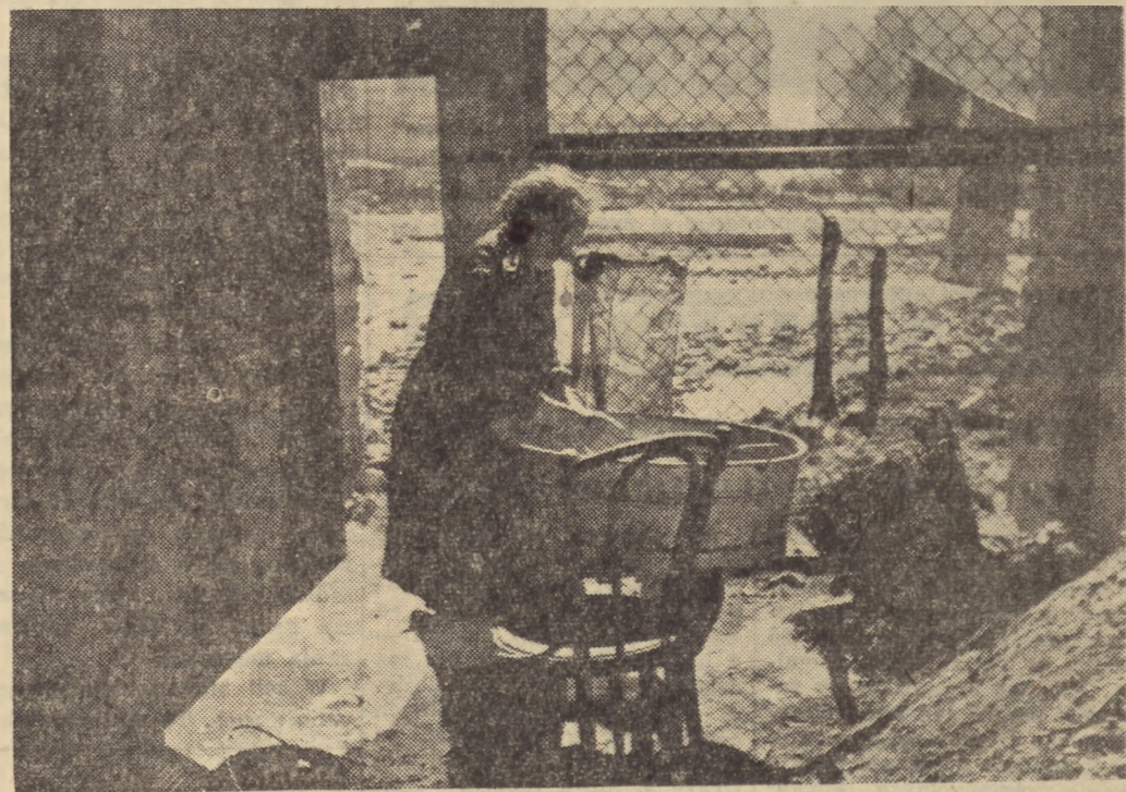
Tak mieszkali w Warszawie w 1945 roku pierwsi warszawiacy, którzy wrócili do swojego miasta

Gdy 17 stycznia 1945 roku wojska radzieckie i u ich boku polskie, rozpoczynając wielką zimową ofensywę przekroczyły