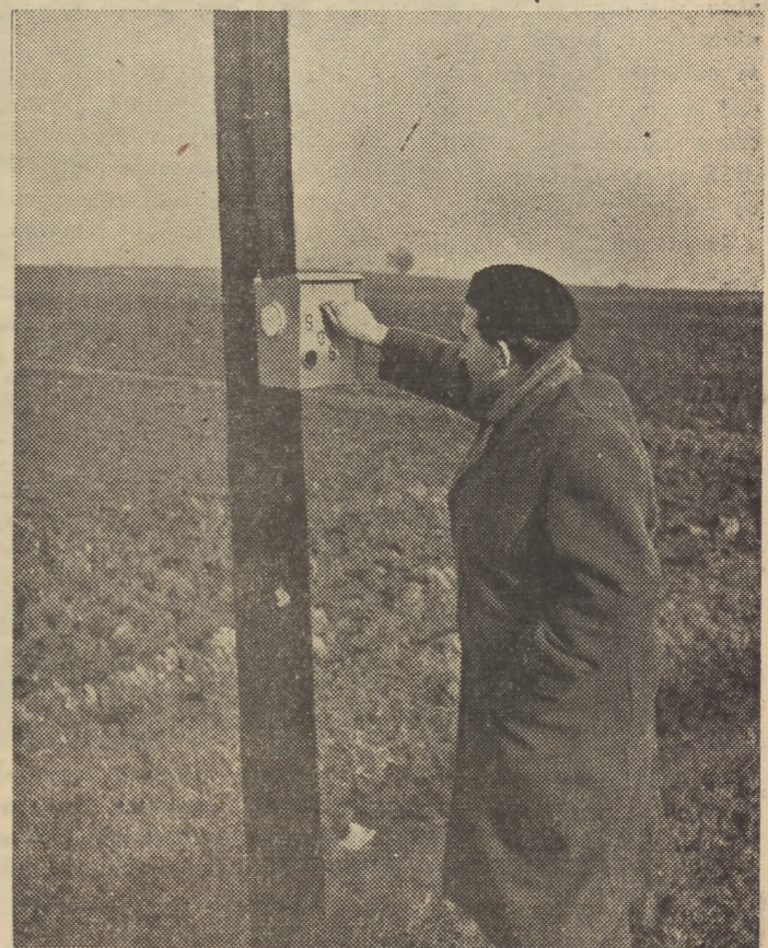
Poczta czechosłowacka wprowadza specjalne telefony dla automobilistów. Przy wszystkich głównych szosach instaluje się aparaty telefoniczne w odległości co dwa kilometry...