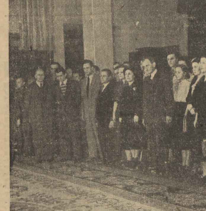
17 bm. odbyło się w Muzeum Narodowym w Warszawie uroczyste dekorowanie orderem „Sztandar Pracy” zespołu Teatru Nowego z Łodzi. Na fotografii członkowie zespołu w czasie uroczystości