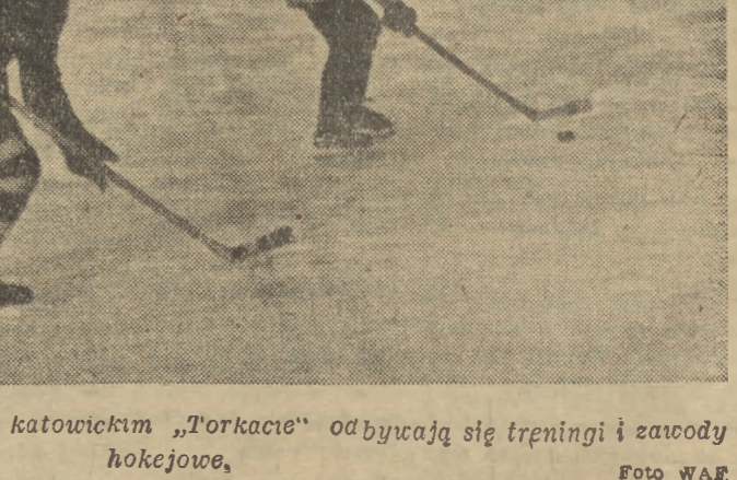
Mimo wiosennej pogody na katowickim „Torkacie” odbywają się treningi i zawody hokejowe.