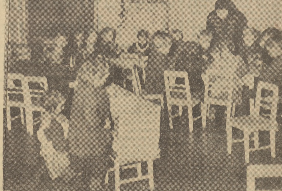
Łci członków spółdzielni produkcyjnej „Witry”, woj. poznańskie, spędzają czas w pięknym przedszkolu i pod troskliwą opieką wychowawczyń