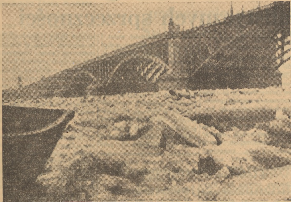
Niebezpieczeństwo powodzi, spowodowane powstaniem poważnych zatorów lodowych na Wiśle, dzięki zorganizowanej akcji przeciwpowodziowej zostało całkowicie zlikwidowane. Na zdjęciu spiętrzona kra pod mostem Poniatowskiego w Warszawie