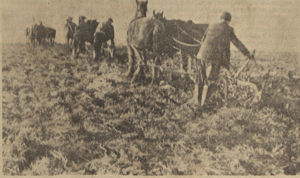
Członkowie spółdzielni produkcyjnej „Zjednoczenie” w gromadzie Barchlin, pow. kosciański, woj. poznański, przystąpili już do orki pól pod kartofle.