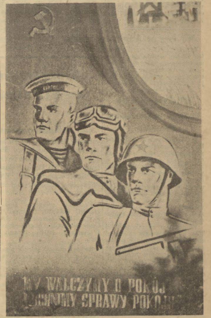
Staraniem Towarzystwa Przyjaźni Polsko - Radzieckiej zorganizowana została w gmachu „Ogniska” w Warszawie wystawa, obrazująca wkład Armii Radzieckiej w walce o wolność narodów, pokój i socjalizm.