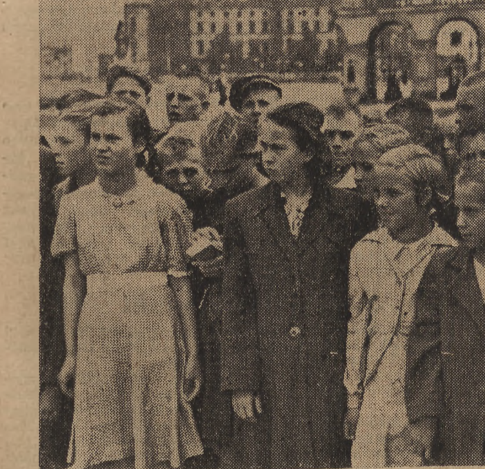
Z inicjatywy Ministerstwa Oświaty do Warszawy przybywają w okresie wakacyjnym liczne wycieczki dzieci chłopskich. Na zdjęciu wycieczka ze spółdzielni produkcyjnych i PGR-ów woj. białostockiego w Ogródzie Saskim w Warszawie.