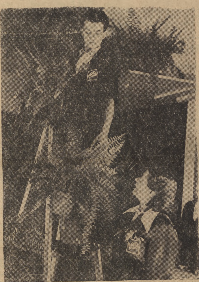
W ostatnich dniach otwarto w Warszawie przy ul. Hożej i przy Al. Sikorskiego dwie kwaciarnie Miejskiego Handlu Detalicznego. Nowe kwaciarnie MHD ze względu na bogaty asortyment kwiatów i przystępne ceny, cieszą się dużym powodzeniem. Na zdjęciu fragment kwaciarni przy Al. Sikorskiego.

do chciał tu powiedzieć: Ci najlepsi są zupełnie nieudolni, a więc skazani na wymarcie. Trudno o ostrzejszy osąd swej własnej klasy.