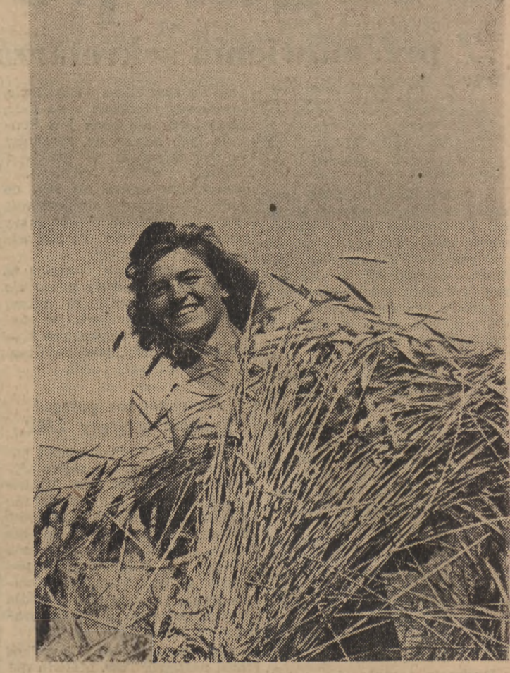
Żniwa na terenie woj. gdańskiego dobiegają końca. Na zdjęciu pracownica PGR Klezewo z radością sprząta ostatnie spony żyta.