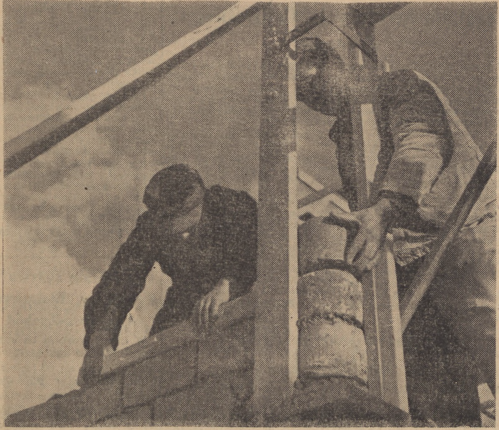
Pracę ich ręk rośnie nowa Warszawa, stolica socjalistycznej Polski