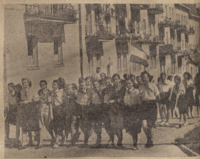
Fragment osiedla robotniczego na Mariensztacie