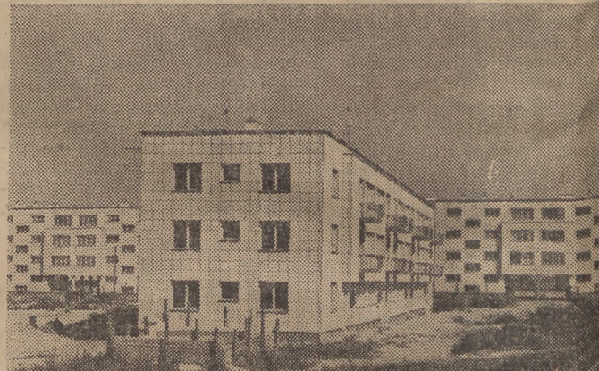
Mieszkalniowe osiedle robotnicze na Kole