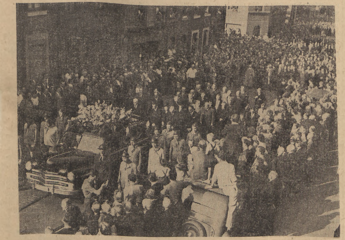
Robotnicy belgijscy na ulicach Seraing żegnają przywódcę Komunistycznej Partii Belgii — Julien Lahaut, bestialsko zamordowanego przez monarcho-faszystów.

Więcej węgla i stali, więcej maszyn i tkanin! Zwiększając produkcję, wykonując przedterminowo plany, wzmagamy nasz wkład w walkę o pokój!