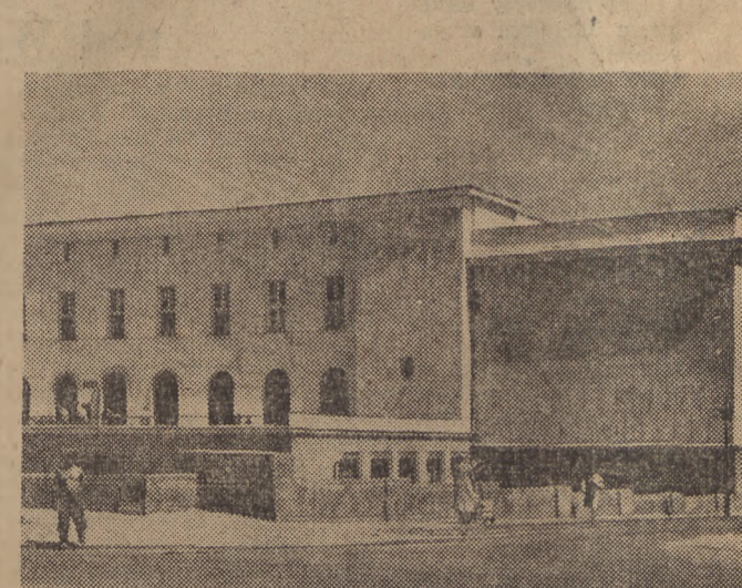
Osrodek Kultury Fizycznej