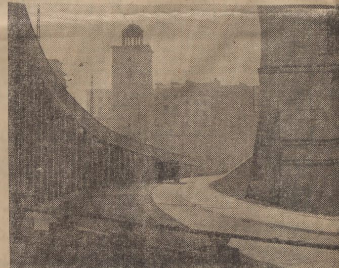
Fragment Trasy W-Z