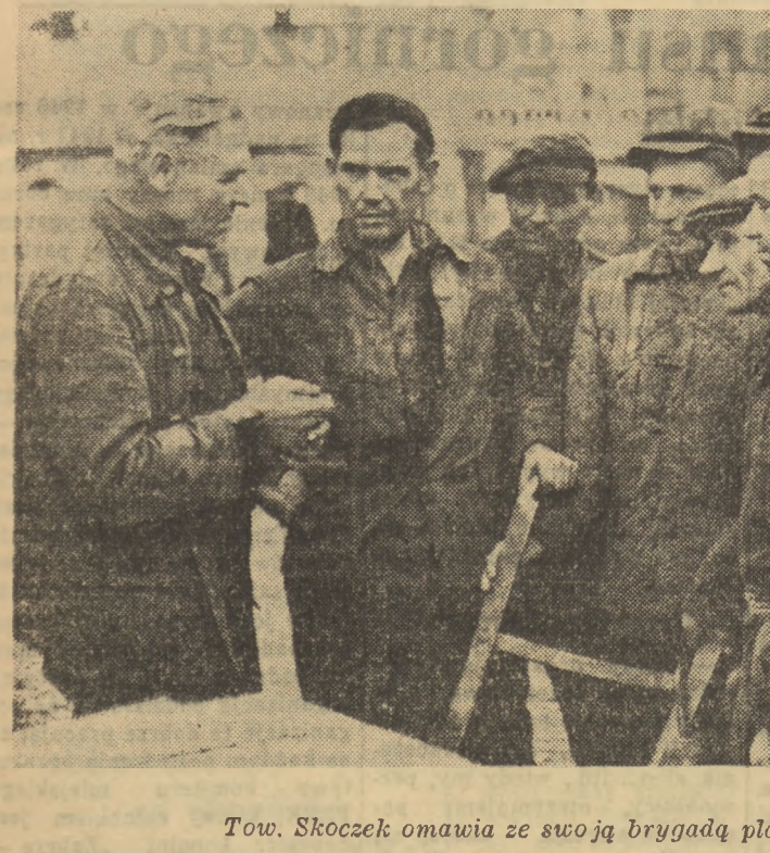
Tow. Skoczek omawia ze swoją brygadą plan pracy