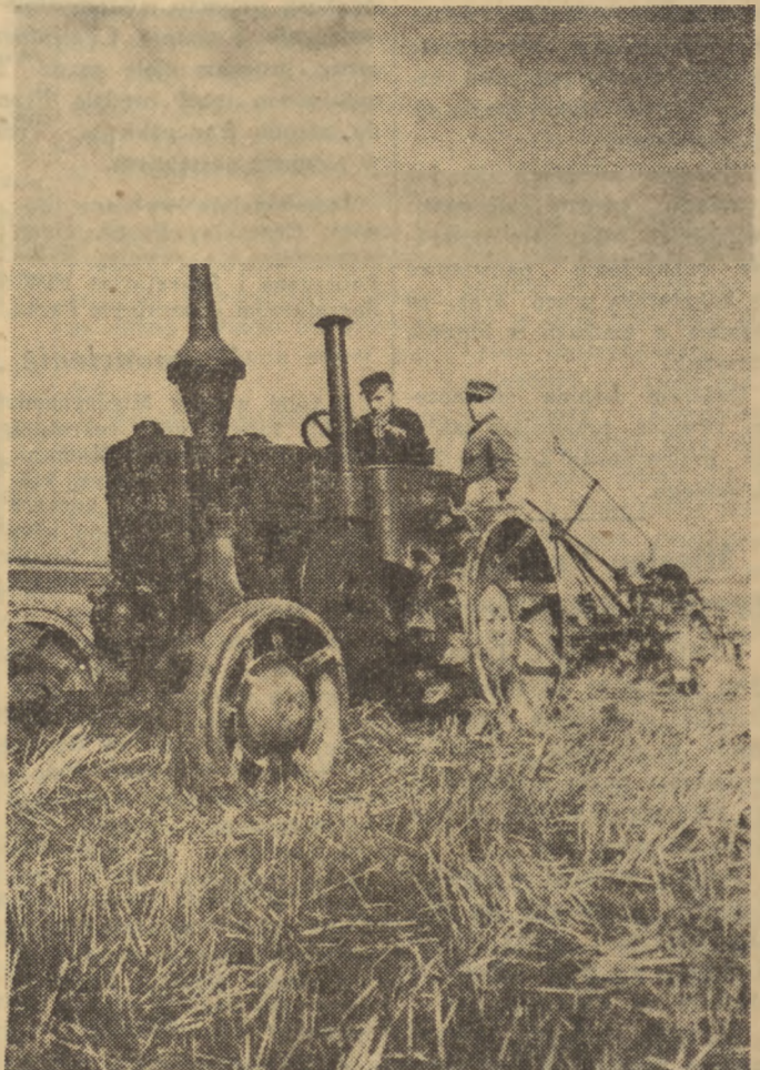
Sprawnie i szybko przebiega ją prace wiosenne na polach spółdzielni produkcyjnej im. gen. Świerczewskiego w pow. legnickim. Na zdjęciu orka przy pomocy traktora polskiej produkcji „Ursus”