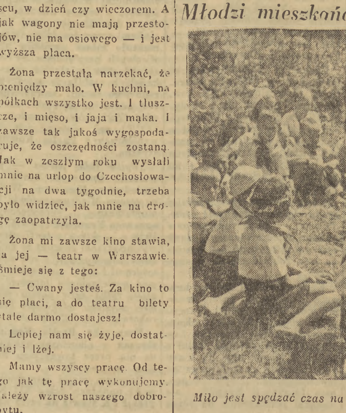
Miło jest spędzać czas na cichych polanach przy ognisku, na którym gotuje się imprezowa...y postęk