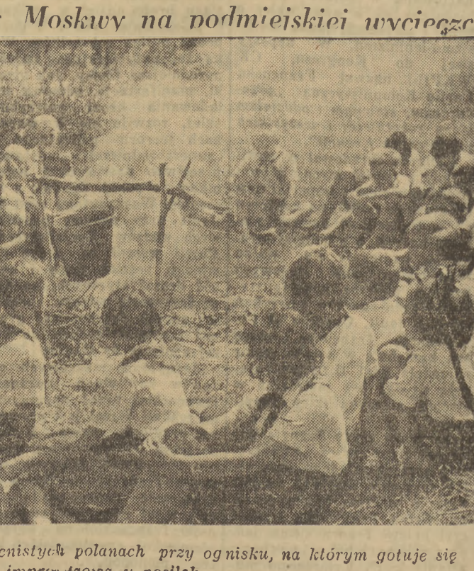
Miło jest spędzać czas na cichych polanach przy ognisku, na którym gotuje się imprezowa...y postęk