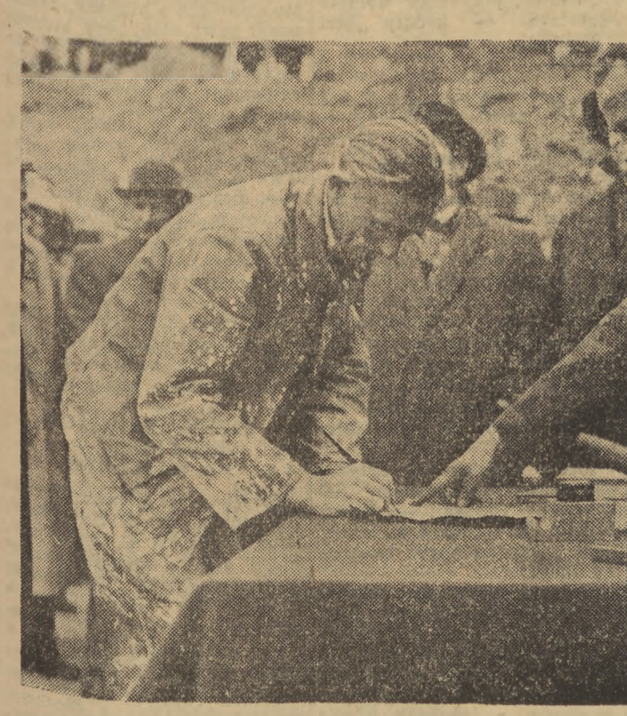
W Warszawie odbyła się uroczystość położenia kamienia węgielnego pod budowę IV pawilonu kompleksu gmachów Państwowej Komisji Planowania Gospodarczego. Na zdjęciu, przewodnik pracy, murarz składa w imieniu załogi podpis na akcie erekcyjnym