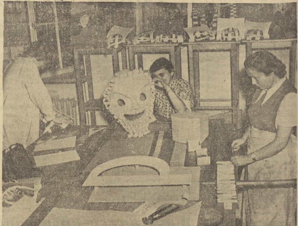
Zespół studentów Państwowej Wyższej Szkoły Sztuk Plastycznych przy opracowywaniu elementów dekoracyjnych na pochód pierwszomajowy.