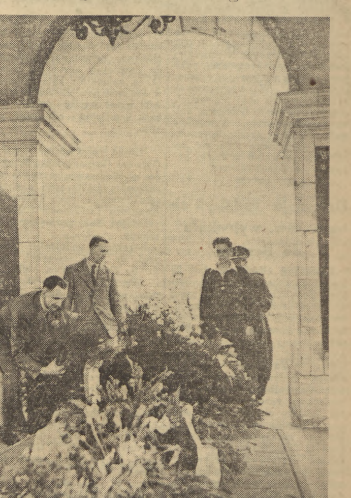
W piątek, 28 bm. w godzinach przedpołudniowych członkowie wszystkich drużyn kolarskich, uczestniczących w III Międzynarodowym Wścigu „Trybuna Ludu” i „Rudego Prawa” — Wścigu Pokoju złożyli na grobie Nieznanego Żołnierza wianki kwiatów i wieńce.