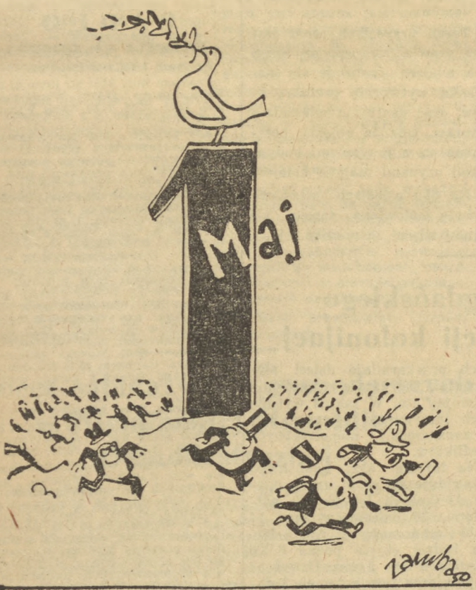
Rys. Jerzy Zabura