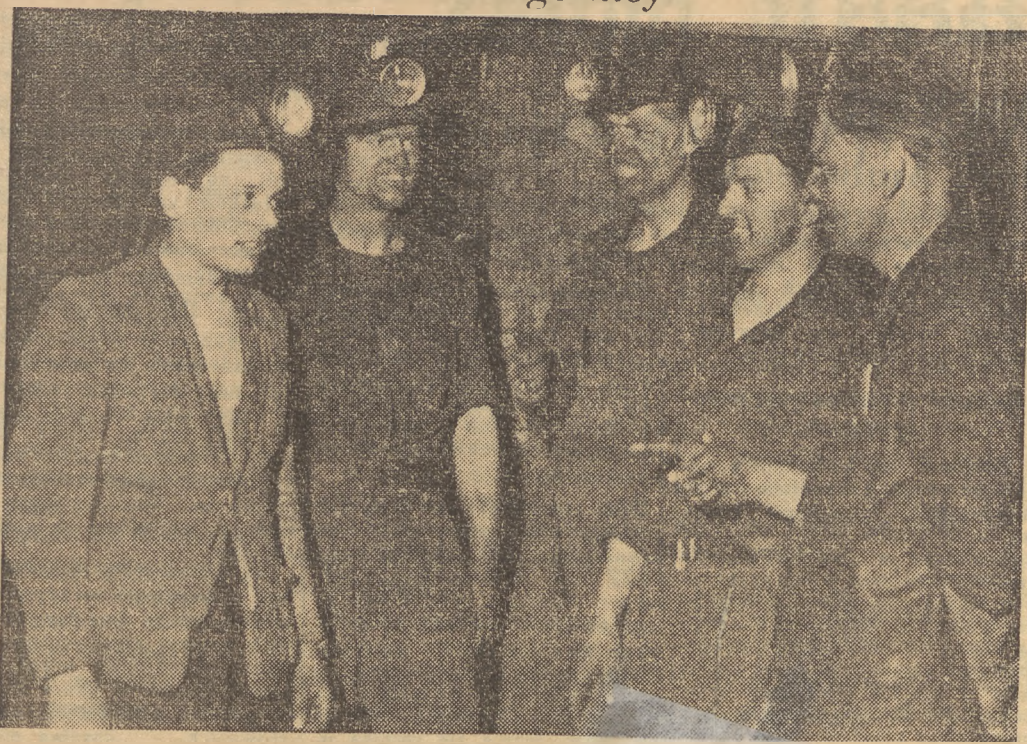
Grupa członków 61 brygady „SP”, którzy pracują na kopalni „Wieczorek”