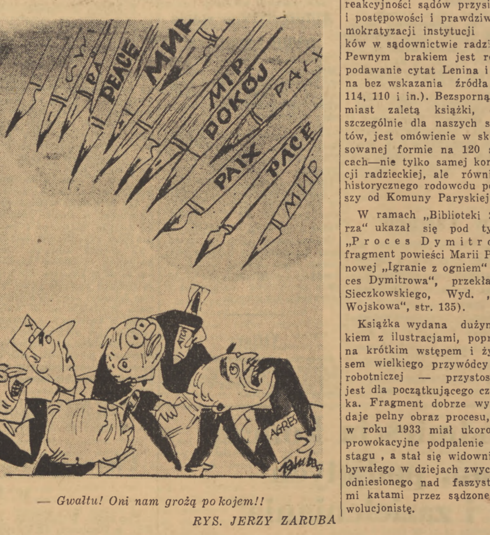
Gwałtu! Oni nam grożą pokojem!!