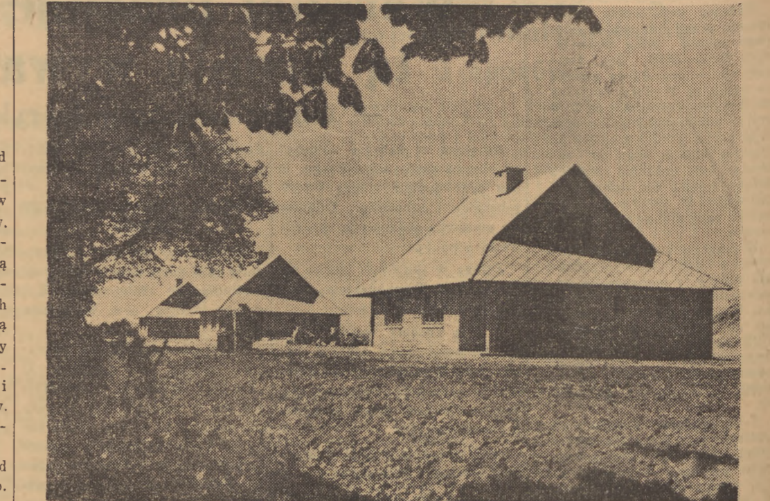
Więś polska, dzięki wybitnej pomocy Państwa zmienia gruntownie swe oblicze. W miejscowości Jakuba Rotbauma, w stylizowanych dekoracjach Jerzego Jędrzejewskiego i Lango, w stylizowanych kostiumach Przeradzkiej, w opracowaniu choreograficznym Sylwii Swen i z niezmiernie melodyjną muzyką operetkową Goldfadena i Kona...