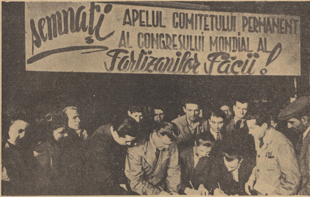
W Rumunii trwa akcja zbierania podpisów pod apelem sztokholmskim. Na zdjęciu pracownicy przedsiębiorstwa „Placara Rosia” w Bukareszcie, podpisują apel