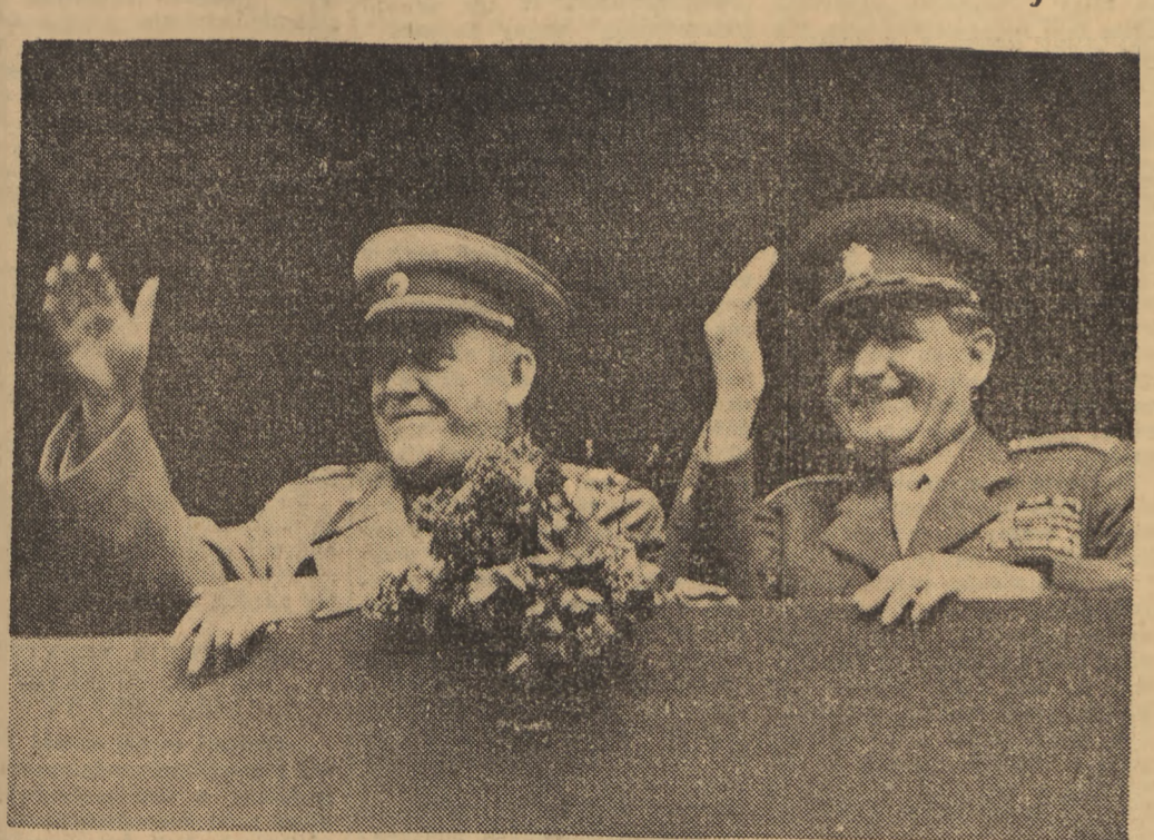
Prezydent Republiki Czechosłowackiej tow. Klement Gottwald i wicepremier Rządu ZSRR, Marszałek Związku Radzieckiego, tow. Bulganin na trybunie honorowej podczas defilady w Pradze