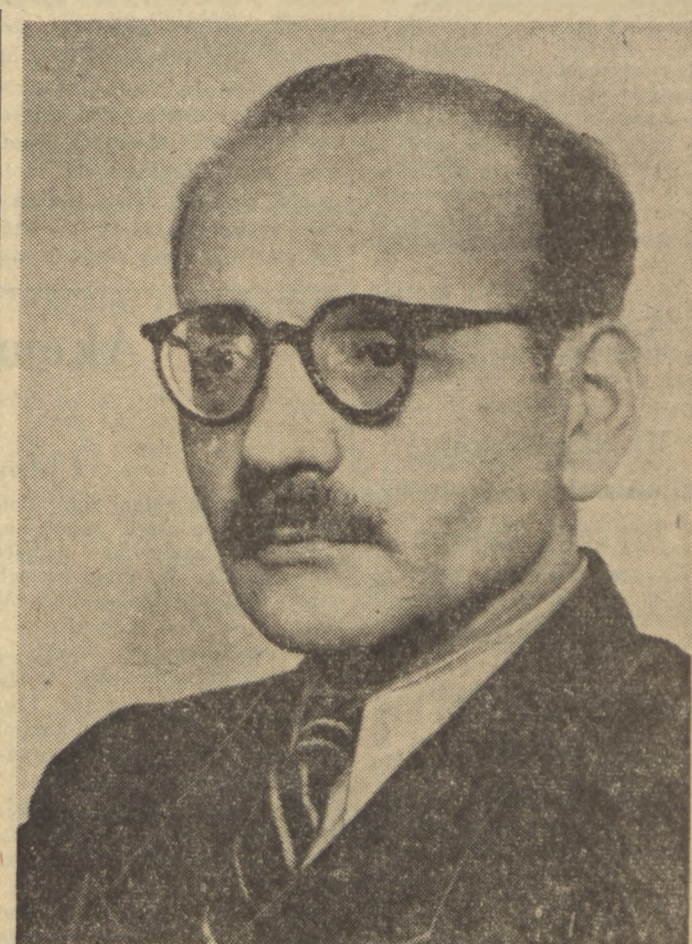
Wychodzące w zakres ich obowiązków w oparciu o podstawowe zadania partyjne, środowisko i instytucje, których te sprawy dotyczą.

Fragmenty referatu przewodniczącego CKKP PZPR tow. Franciszka Józwiaka-Witolda na IV plenarnym posiedzeniu Komitetu Centralnego i Centralnej Komisji Kontroli Partyjnej w dniu 8 maja 1950 r.