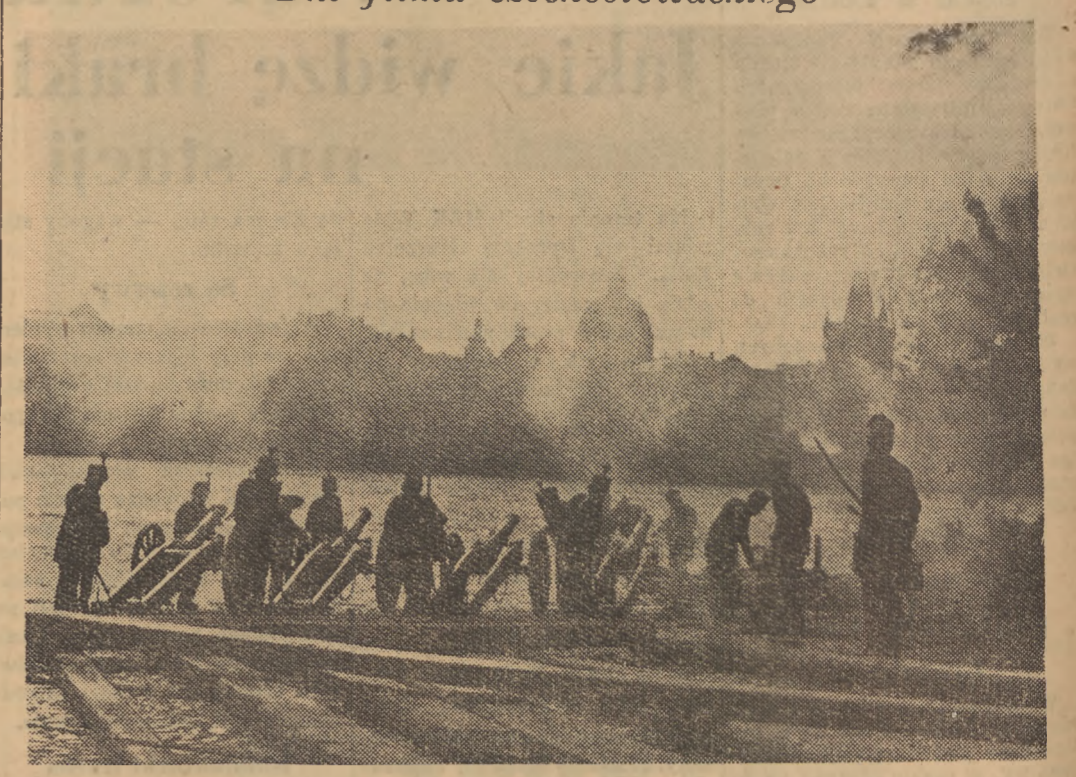
Dni filmu czechosłowackiego i inauguruje w dniu 17 4 m. premiera dramatu historycznego, osnutego na tle wydarzeń „Wiosny Ludów” - „Praga roku 1848”...