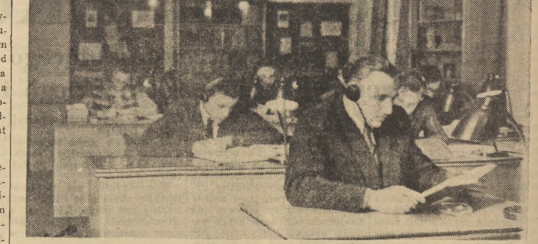
Z pracy Centralnego Ośrodka Szkolenia Partyjnego w Warszawie (ul. Mokotowska 25). Aktywiści przysłuchują się zbiorowym zajęciom odbywającym się o piętro wyżej.

W roku bieżącym ok. pół miliarda złotych będzie wypłacone przez Państwową Centralę „Las” zbieraczom jagód, grzybów i ziół leśnych. Ma to duże znaczenie dla podniesienia dochodu społecznego wsi, ponieważ rolnik, lub jego rodzina, biorąc udział w zbiorze runa leśnego nie ponosi żadnych nakładów, czy to na materiały, czy też narzędzia, a przy zbiorze zatrudnieni są przeważnie członkowie rodzin chłopów bezrolnych lub małorolnych.