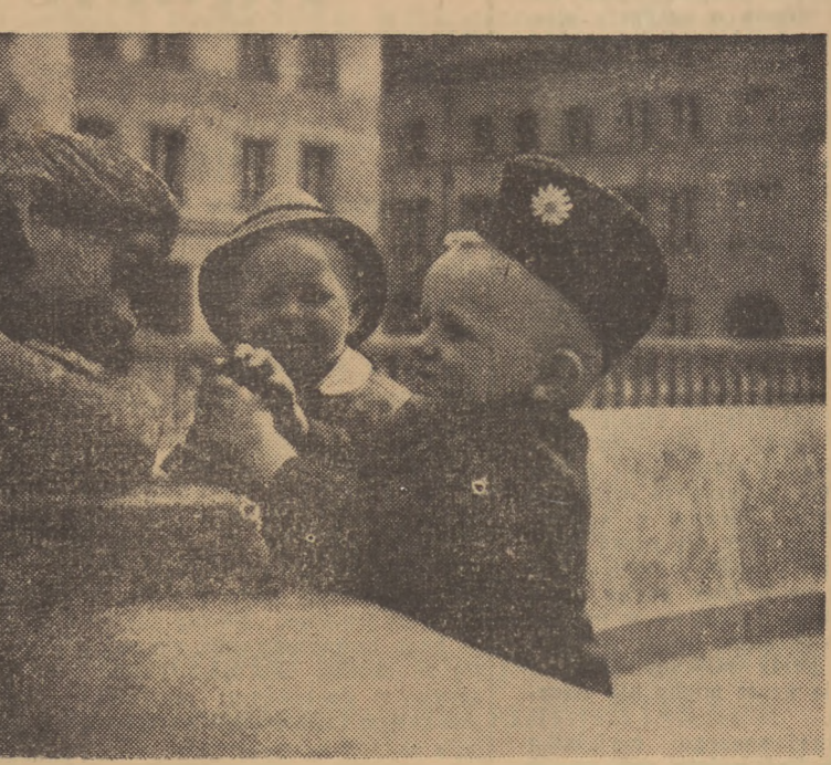
Dzieci przy fontannie mariensztackiej, którą usiłują uruchomić