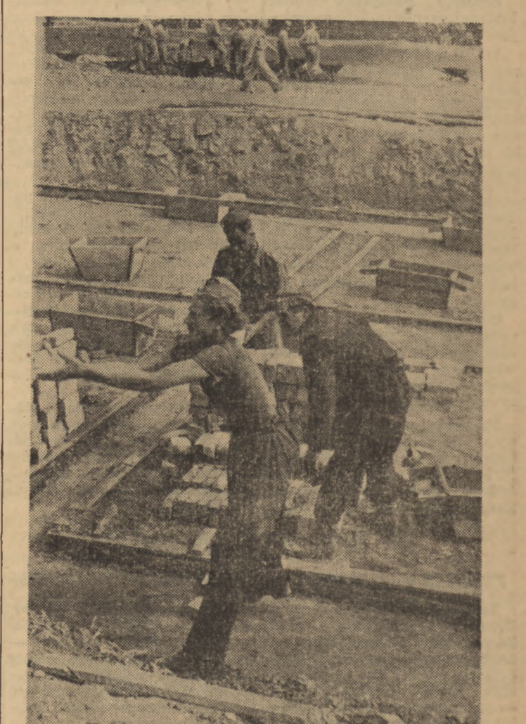
51 brygada ochotnicza ZMP rozpoczęła pracę przy budowie miasta Nowa Huta, powstającego obok wielkiego kombinatu hutniczego Nowa Huta pod Krakowem. Na zdjęciu młodzieżowa trójka murarska przy pracy.