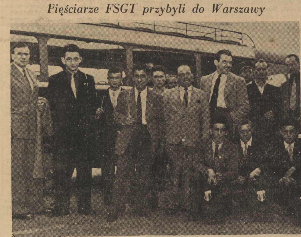
Do Warszawy przybyła reprezentacyjna drużyna pięściarska FSGT (Francuska organizacja sportu robotniczego). Pięściarze francuscy rozegrają mecz z reprezentacją polskich związków zawodowych.