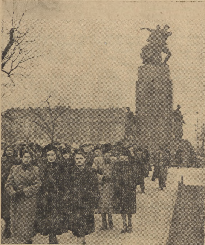
Przebywający w Warszawie artyści ukraińskiego Teatru Dramatycznego im. Iwana Franko zwiedzają stolicę. Na zdjęciu artyści ukraińscy przed pomnikiem Braterstwa na Pradze