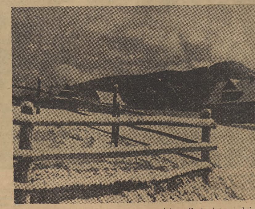
Piękne Tatry pokryte są już grubą warstwą śniegu. Narty, śnieg i słonec pozwolą człowiekowi pracy na zapobiegnięcie zdrowia i nowych sił do pracy.