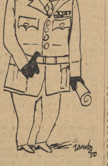
Pengergast „odkrył” Harry Truman i pchnął go na drogę, wiedząc o Białym Domu.

Wówczas to właśnie, w 1946 roku — Winston Churchill zrzucił w Fultonie hasło „zimnej przegrzynki do gorącej wojny”.