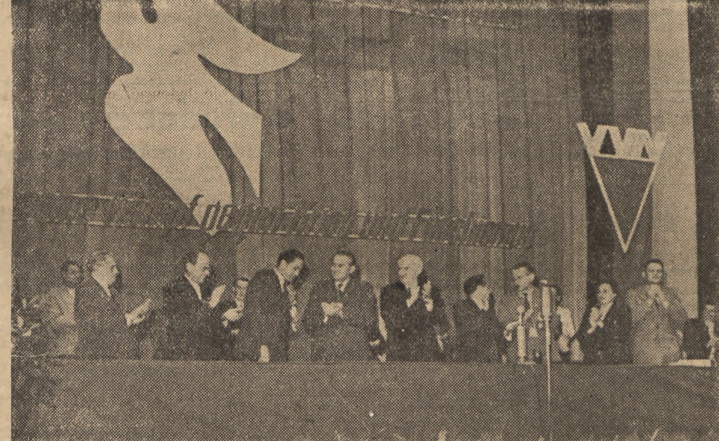
Berliński Związek Uczestników Walki z Faszystym zorganizował wielką manifestację na rzecz przyjaźni niemiecko-francuskiej, na której przemówienia wygłosił: ptk Manhes (Paryż), honorowy przewodniczący FIAPP i Franz Dahlem, członek Rady Związku Niemieckiego. Na zdjęciu powitanie francuskich uczestników Ruchu Oporu.