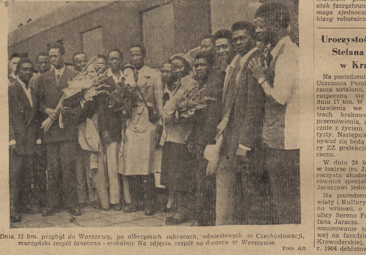
Dnia 13 bm. przybył do Warszawy, po olbrzymich sukcesach, odniesionych w Czechosłowacji, murzyński zespół taneczno-wokalny. Na zdjęciu zespół na dworcu w Warszawie.