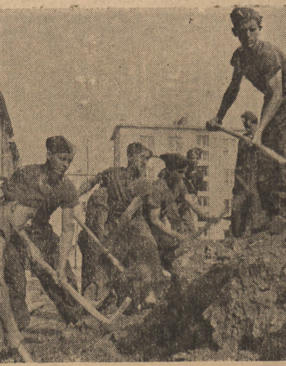
Junacy III turnusu brygad SP przystąpił już do pracy. Na zdjęciu jedna z brygad podczas prac porządkowych na ośledu Mirów.