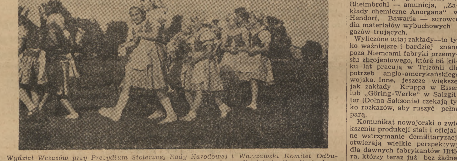
Wydział Wczasów przy Prezydium Stołecznej Rady Narodowej i Warszawski Komitet Odbudowy Stołeczki zorganizowały w ostatnią niedzielę wielką zabawę dla dzieci. Na zdjęciu fragment występu dziecięcego zespołu tanecznego.