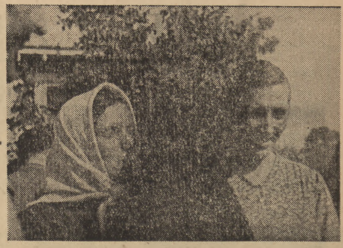
Spotkanie z kolchoźnikami radzieckimi w Wyrkach. (Do artykułu R. Jurysa)

Taka nam się właśnie przytrafiła jestnia życia w Ojczyźnie. I to jest największe szczęście. Szczęście drzewa, co na wiosnę wypuszcza zielone listeczki, choćby już parę lat rosło w wiecznej młodej ziemi. Bądź wiecznie młody, wiecznie walczący i śpiewający... Trzeba piśmią bić aż do śmierci, Trzeba głuszyć w ciemnościach, Jest gdzieś życie piękniejsze od wierszy I jest miłość — i ona zwycięży.