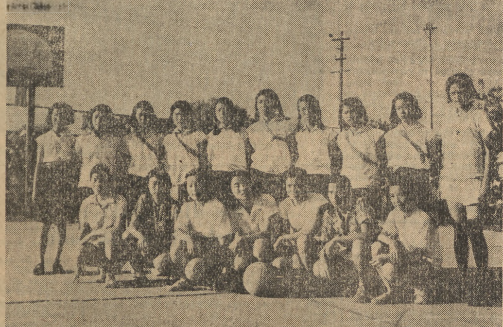
Umasowienie sportu i wychowania fizycznego w Chinach robi coraz większe postępy. Na zdjęciu żeński zespół koszykówki uniwersytetu w Pekinie