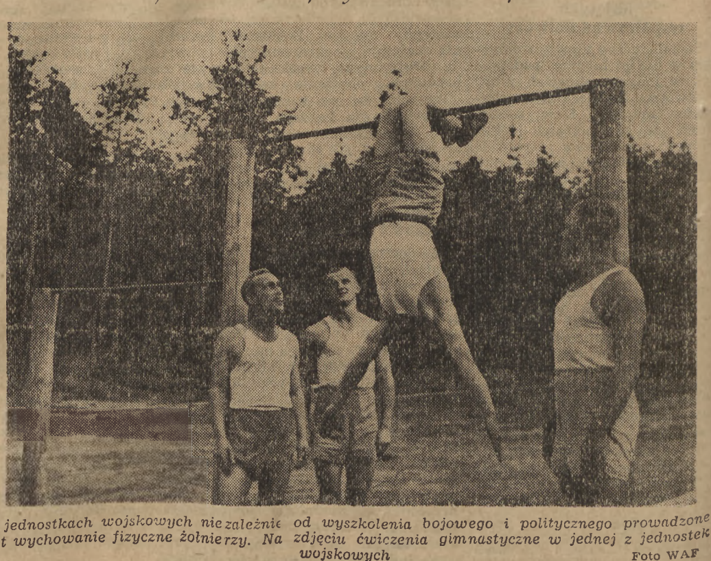
W jednostkach wojskowych nie należy zaniedbać wyszkolenia bojowego i politycznego prowadzone w ramach wychowania fizycznego i politycznego w jednostkach wojskowych