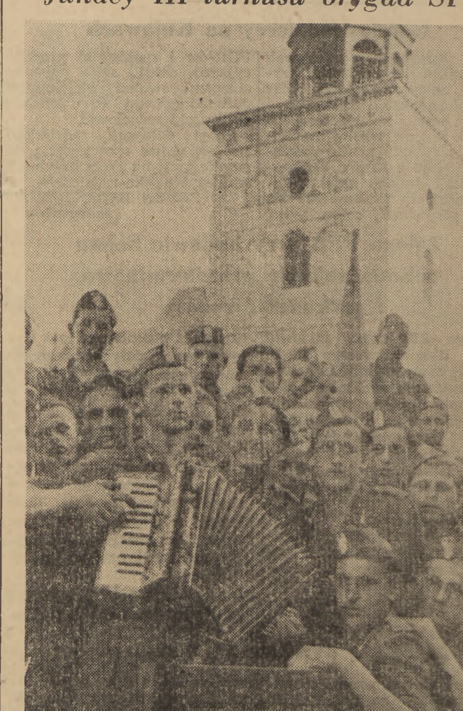
Młodzież z woj. krakowskiego w III turnusie brygad SP pracuje w stolicy. W dniach wolnych od zajęć junacy zwiedzają zabytki Warszawy i oglądają osiągnięcia budownictwa socjalistycznego. Na zdjęciu junacy pozują fotoreporterowi na trasie W-Z