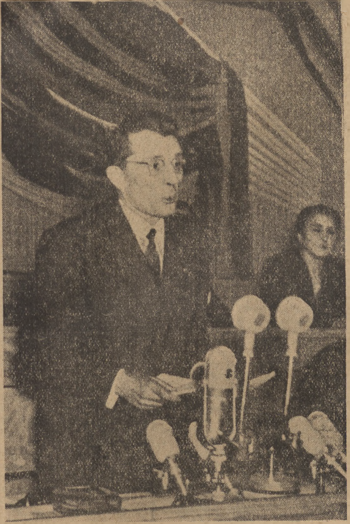
Przewodniczący Stałego Komitetu Światowego Kongresu Obrońców Pokoju prof. Fryderyk Joliot-Curie wygłasza przemówienie (Streszczenie przemówienia zamieszczamy na str. 2-4.)