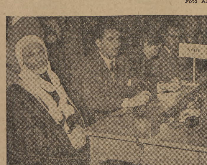
Członkowie delegacji Syrii na sali obrad Kongresu.