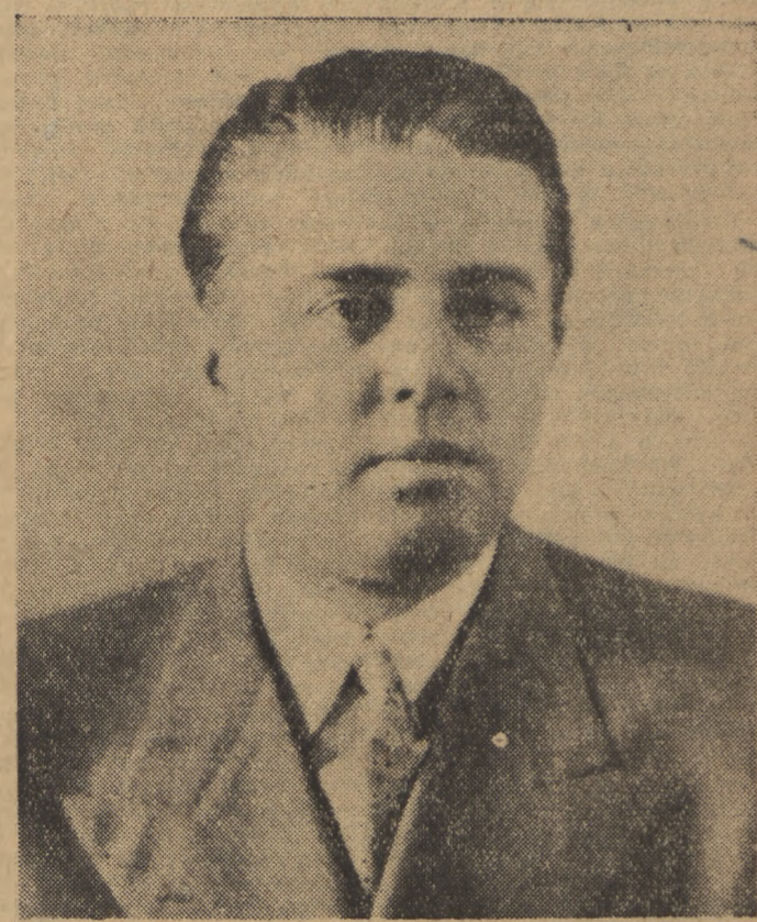
Premier Enver Hodża — Premier Ludowej Republiki Albanii