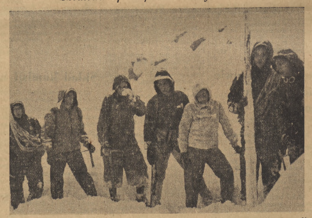
Dla uczczenia II Światowego Kongresu Obróńców Pokoju grupa polskich taterników podjęła wyprawę na szczyt Tatr - w drodze na Rysy.

I oto Hindusi, którzy zajmują jedną trzecią obszaru miasta Durban, będą musieli w ciągu niespełna roku opuścić mieszkania w domach czynszowych. Jeżeli zaś posiadają własne domy stana się one po ich śmierci własnością gminy lub miasta.