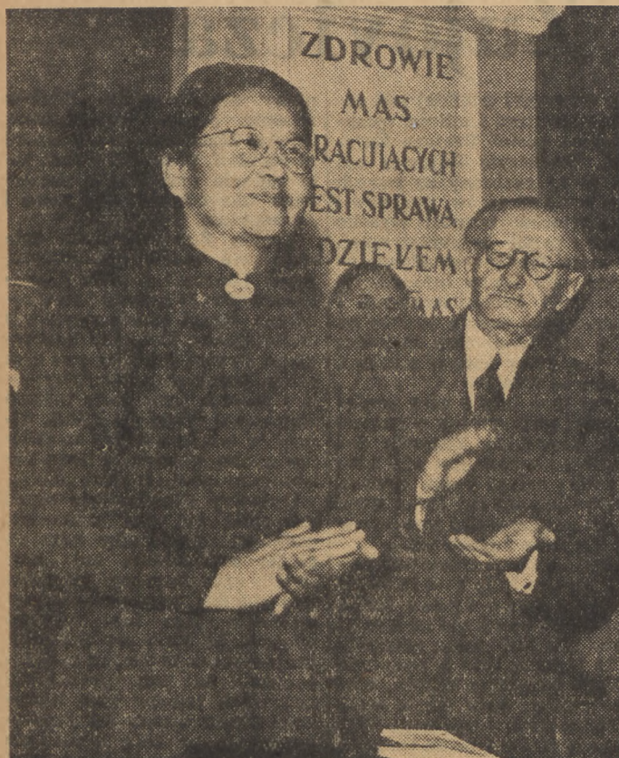
W Warszawie odbyła się krajowa narada aktywu służby zdrowia. Na naradzie przybyła p. Li Teh-chuan, minister zdrowia Chińskiej Republiki Ludowej, delegatka na II Światowy Kongres Obróńców Pokoju. Na zdjęciu p. Li Teh-chuan i minister Michejda.