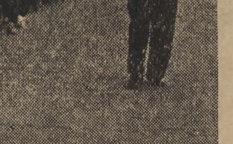
15 i 16 bm. lekkoatleci węgierscy rozegrają w Warszawie międzypaństwowy mecz z reprezentacją Polski.