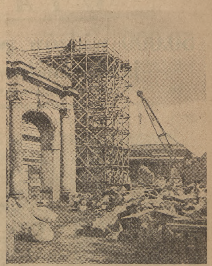
Rozpoczęte prace przy odbudowie Zamku Królewskiego szybko postępują naprzód. Po uświeleniu gruzów i ziemi, zabezpieczono kamienne ozdoby i ocalałe kolumny Zamku.