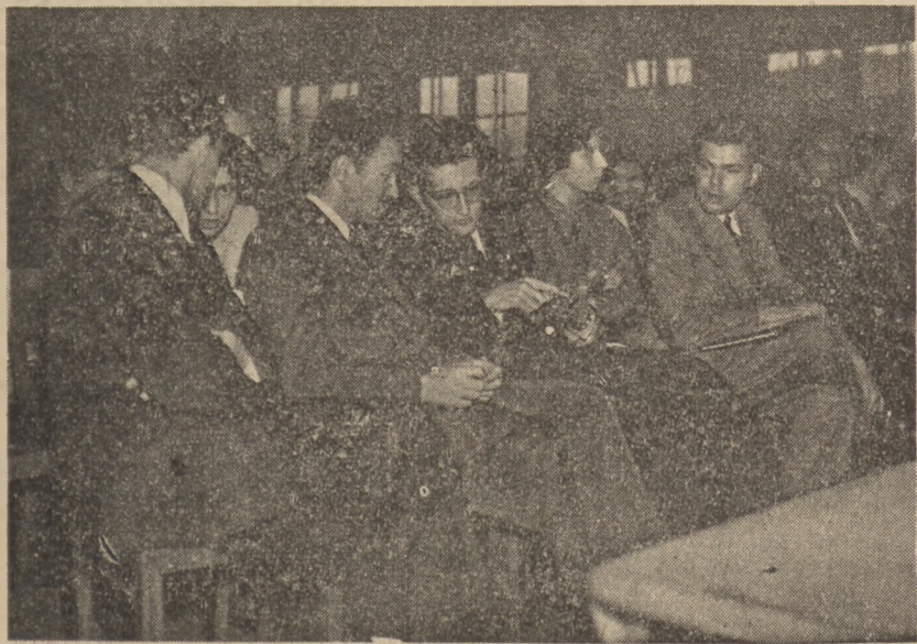
Przy odrobinie dobrej woli i... pomocy rąk można się doskonale porozumieć. — Na zdjęciu delegaci zagraniczni w przyjaznej pogawędce.