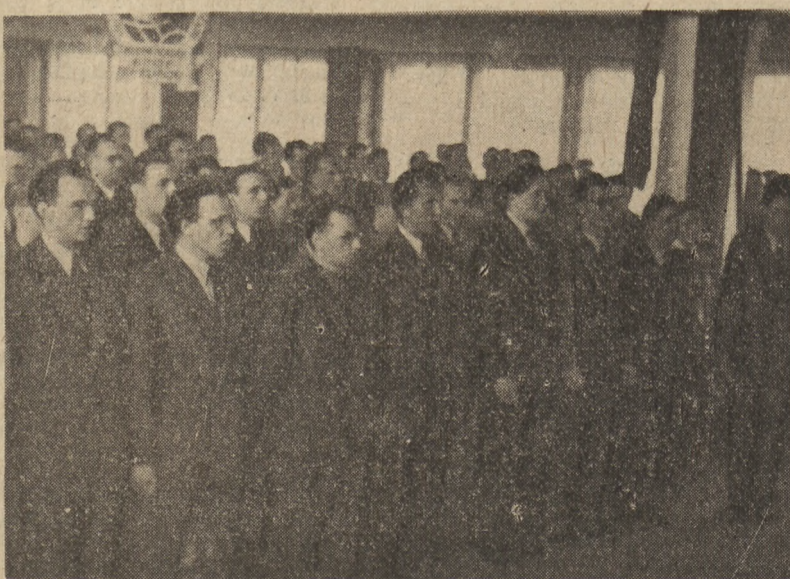
„Hej przyjaciele ramiona swe złączcie, pieśni studencka nad światem się wzniesie...”