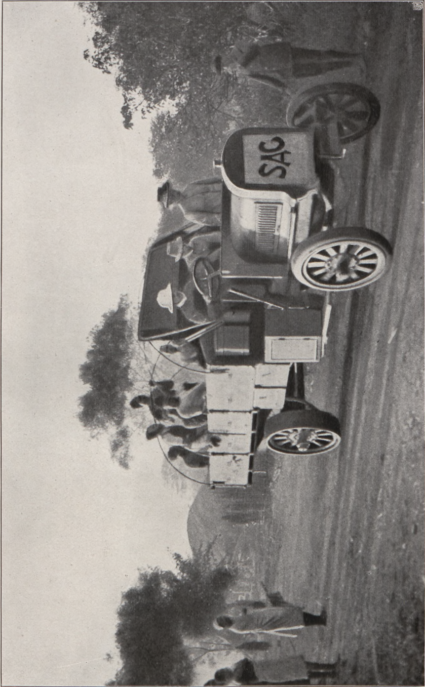
Bahnbau Morogoro - Tabora Lastautomobil von 35 PS. und 5 t Tragkraft