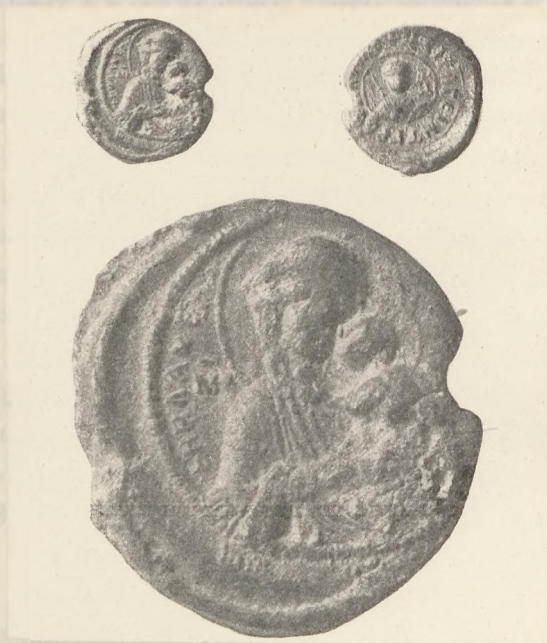
Свинцовая печать с изображением Влахернитиссы.

Отказываясь от своей теории, я в дополнение предложу вниманию читателей издаваемый мною памятник, представляющий византийскую свинцовую буллу малых размеров (19—20 мм., толщ. ок. 2,5 мм.). 2