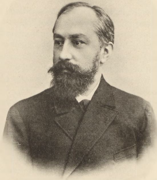
А. И. Соболевский в 90-х годах.