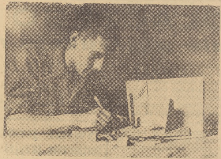
W Szkole Sztuk Pięknych w Sopocie kształcą się młode talenty