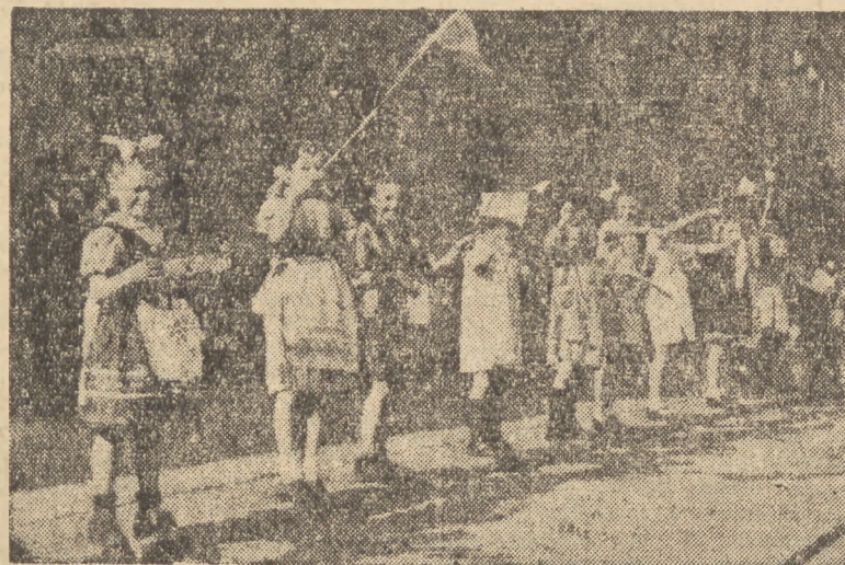
Dzieci witają przejeżdżających kolarzy