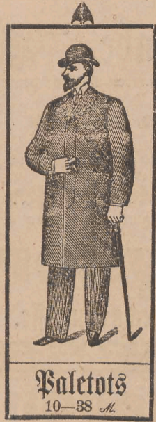
Paletots 10-38 M.

Fertige Confection in tadelloser Passform. Elegante Maafanfertiigung. Streng feste Preise.