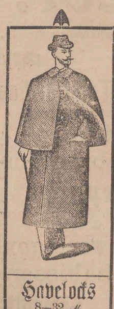
Sabelods 8-32 M.