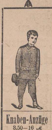
Knaben-Anzüge 3,50-16 M.