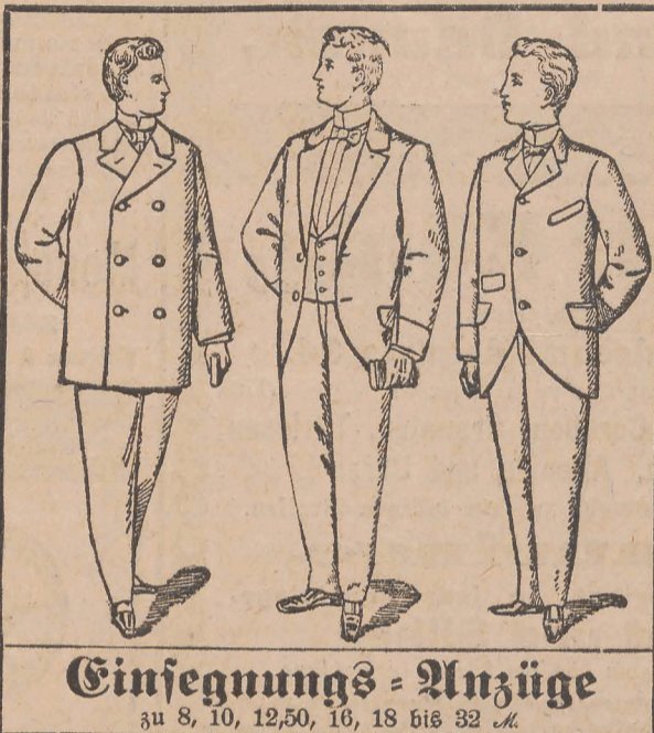
Einfegnungs-Anzüge zu 8, 10, 12,50, 16, 18 bis 32 M.