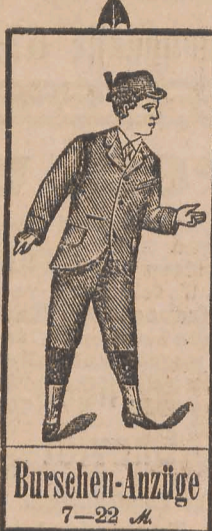
Burschen-Anzüge 7-22 M.