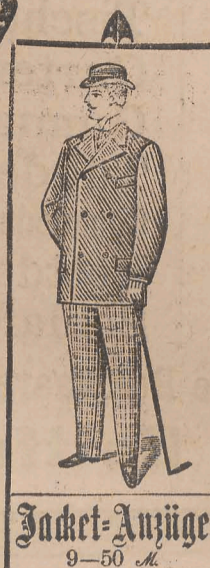
Jacket-Anzüge 9-50 M.