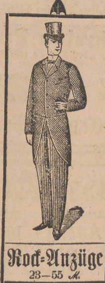
Rock-Anzüge 23-55 M.