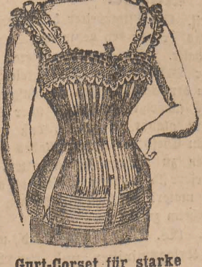
Gurt-Corset für starke Damen.

Lager eigener, deutscher, Pariser, Brüsseler und englischer Corsets von den einfachsten bis zu den elegantesten Genres, in vollendeten Schnitten, verleihen der Figur größte Bequemlichkeit, höchste Eleganz u. Formenschönheit.