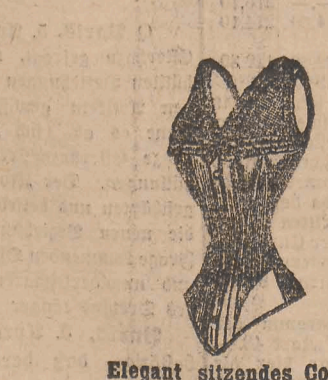
Elegant sitzendes Corset für schlanke Damen.