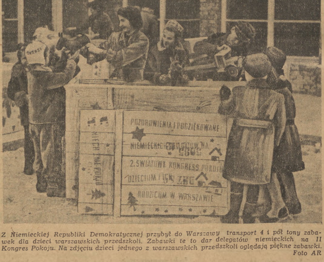
Z Niemieckiej Republiki Demokratycznej przybył do Warszawy transport 4 i pół tony zabawek dla dzieci warszawskich przedszkoli. Zabawki te to dar delegatów niemieckich na II Kongres Pokoju. Na zdjęciu dzieci jednego z warszawskich przedszkoli oglądają piękne zabawki.

dacza zabierze ze sobą do swego domu. Mieszkańcy inscenizatorzy ustowiali doszukiwać się w sztuce Ostrowskiego mieszczańskiego moralu: wydawało im się, że Ostrowski pragnie potępić oszustów i wydrwigroszów, przeciwstawiając im uczciwych bogatych kupców. Mylili się jednak. Ostrze satyry Ostrowskiego smaga bowiem również bezsilność bezduszną postać kupca Prybkitowa, jego metody postępowania, stosunek do rodziny i ludzi, jak demaskuje tu ustroj, który zrodził takie stosunki i umożliwił bezkarny byt i egzystencjonalizm i wydaje się, że gdyby sztuka dostała się w ręce mniej doświadczonych i mniej świadomych reżyserów, mogła by łatwo przekształcić się w przedstawienie na temat podłości i złych charakterów wszystkich bez wyjątku ludzi. Tylko realistyczna koncepcja inscenizacji, nakreślenie akcji na tło historyczne — gospodarcze i społeczne — uwarunkowania działań ludzkich, zapewnią przedstawieniu jego demaskatorski i oskarżycielski sens.