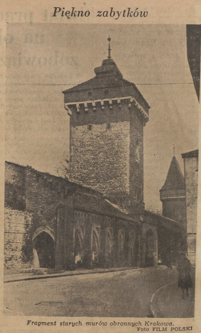
Fragment starych murów obronnych Krakowa.

Po zakończeniu konserwacji to arcydzieło sztuki gotyckiej