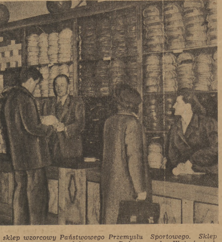
W Katowicach otwarto ostatnio sklep wzorcowy Państwowego Przemysłu Sportowego. Sklep jest bogato zaopatrzony w doskonały sprzęt wyprodukowany w Państwowych Wytwórniach Sprzętu Sportowego. Na zdjęciu fragment nowoutwartej sekcji.