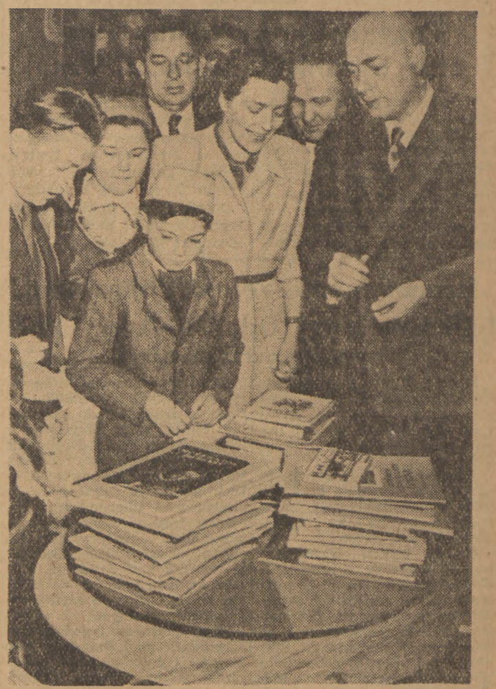
Tow. premier J. Cyrankiewicz w towarzystwie członków Rządu przybył na szkolną noworoczną dla dzieci urzędową przystanku TPD w gmachu Szkoły Głównej Służby Zagranicznej. Na zdjęciu tow. premier w serdecznej rozmowie z dziećmi.