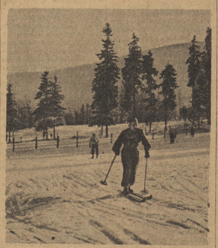
Ostatnio odbyły się w Zakopanem zorganizowane przez Polski Związek Narciarski pierwsze masowe zawody na odznakę „Sprawny do pracy i obrony”. Na zdjęciu: młodzi narciarze w czasie biegu.