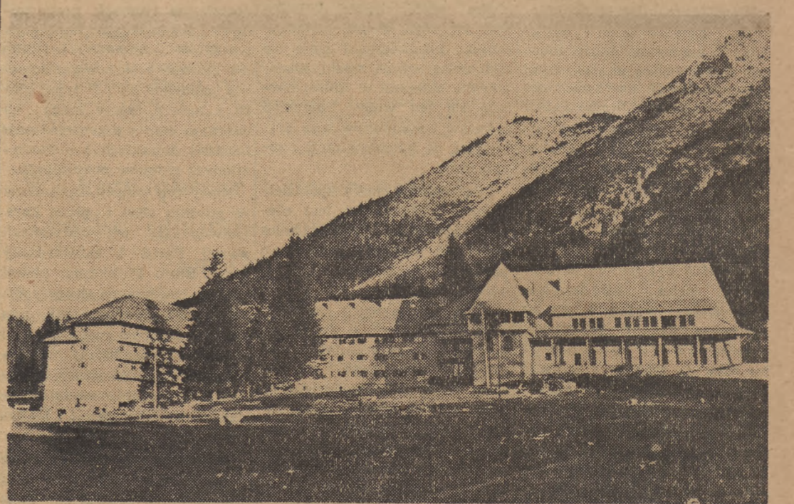
W ramach budowy wielkiego kombinatu sportowego w Poianie (Rumunia), wybudowano już wielki hotel sportowy. W hotelu tym mieszczą będą zawodnicy, którzy wezmą udział w zimowych akademickich mistrzostwach świata, które odbędą się przy końcu bieżącego miesiąca w Poianie.