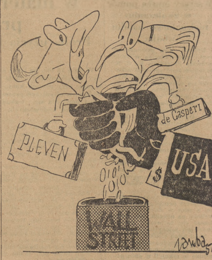
Zbliżenie francusko-łoskie Rys. JERZY ZARUBA