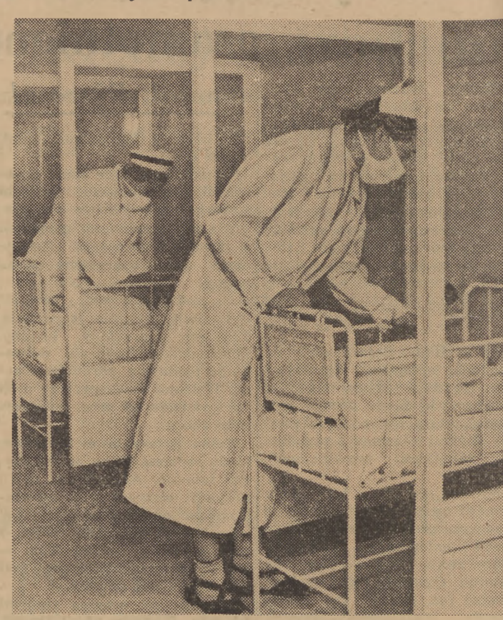
Sala dla niemowląt w nowootwartym szpitalu położniczym przy ul. Karowej w Warszawie.