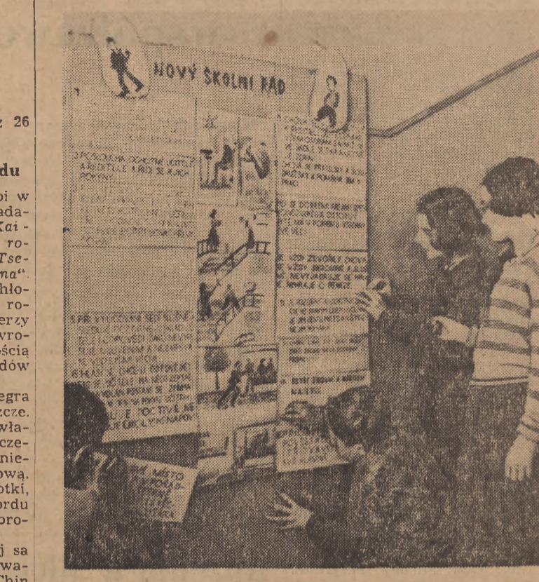
Spośród 303 uczniów szkoły średniej Nr 7 w Pradze, 180 należy do organizacji Pionierów. W każdej klasie organizowane są kółka, w których przygotowuje się lekcje i pomaga słabszym towarzyszom.