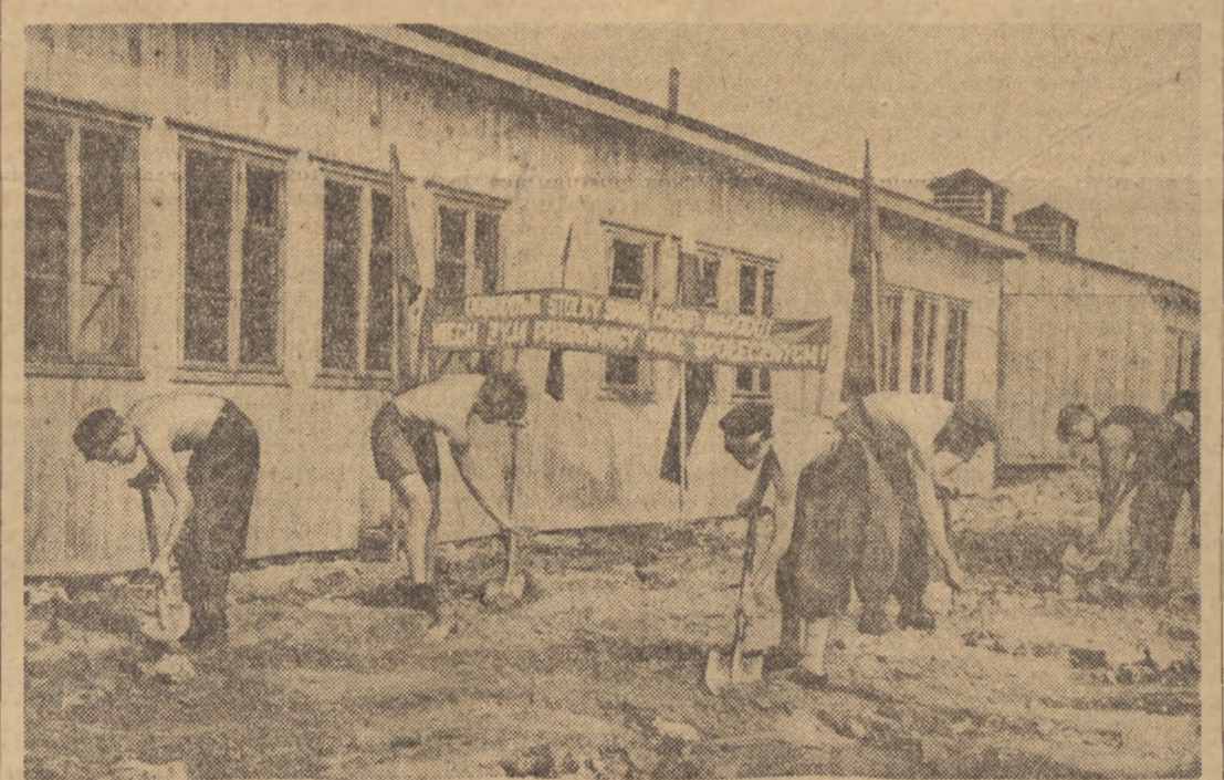
Junacy Służby Polsce, uczestniczący w warszawskich, przystąpili w tych dniach do ochotniczych prac społecznych. Na zdjęciu członkowie hufca SP ze szkoły im. Poniatowskiego wykonują prace niwelacyjne w rejonie ulic Elbląskiej i Przemyskiej.