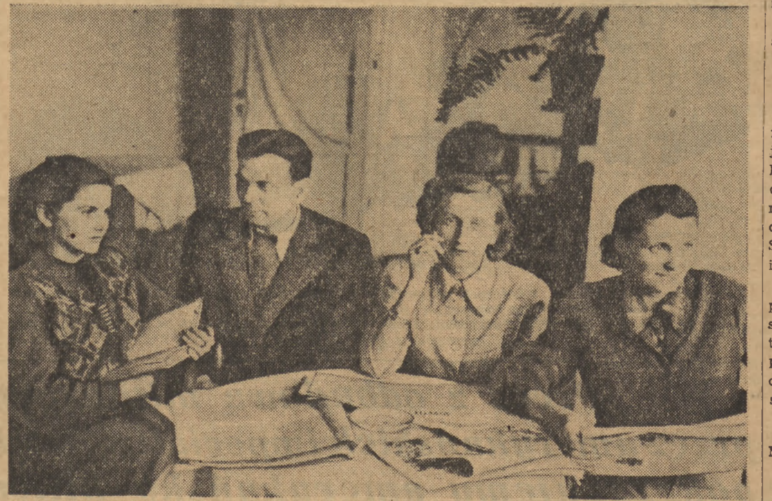
W uzdrowskach polskich, dostępnych w Polsce kapitalistycznej jedynie dla nielicznych wybranych, leczą się dziś ludzie pracy. Na zdjęciu kuracjusze w świetlicy Zakładu Zabiegów...