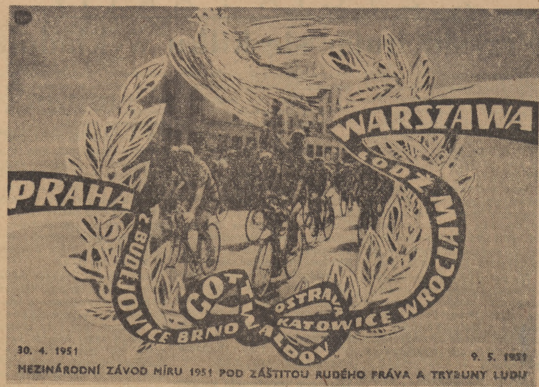
Plakat czechosłowacki, wydany z okazji IV Międzynarodowego Wyścigu Pokoju „Trybuna Ludu” i „Rudeho Prava”